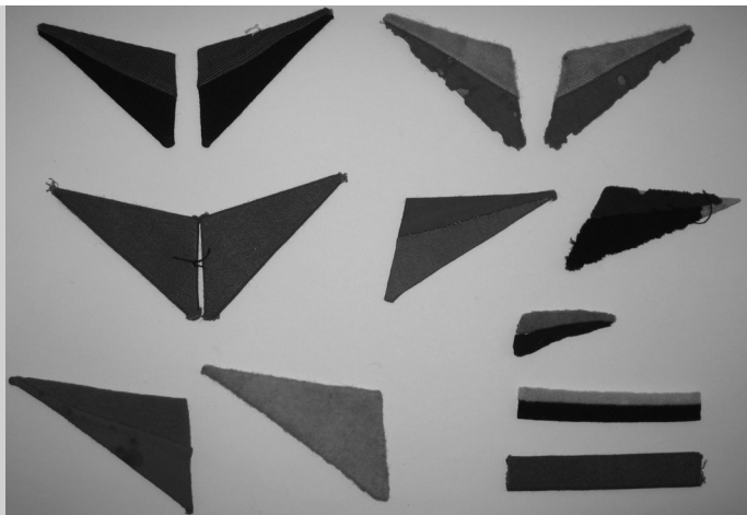
Przykładowe patki, wzór 1945 z układem barw według przepisów z lat 1943 i 1945. Zbiory prywatne.

Oficerowie nosili barwy broni w zależności od przydziału do korpusu osobowego. Lekarze, oficerowie techniczni, oficerowie uzbrojenia, oficerowie intendenty itd. nosili barwy swojego korpusu osobowego pomimo pełnienia obowiązków w pułkach piechoty, artylerii itp. 4