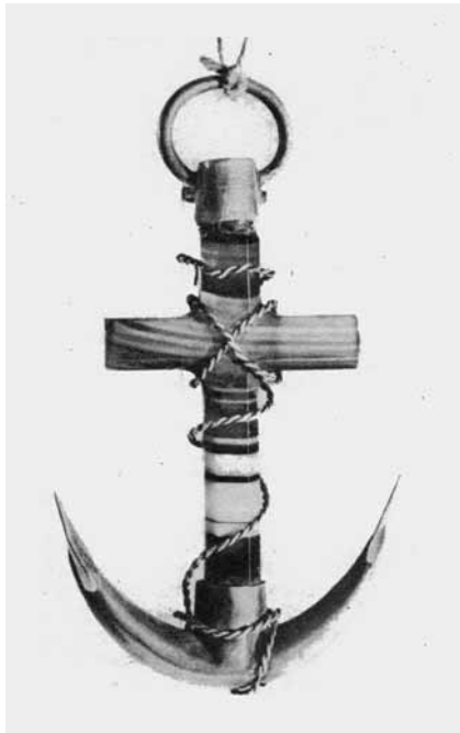
9. Broszka-wisior w kształcie kotwicy wykonana z pasiastego agatu z elementami srebra i miedzi, lata 60. XIX wieku, własność Muzeum Niepodległości.