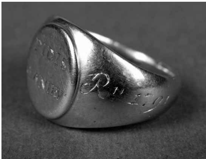
2. Pierścień Fidis Manibus z czasów Konstytucji 3 Maja, 1791 rok, wykonany w złocie, grawerowany