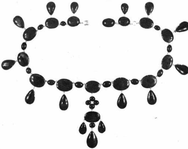
6. Naszyjnik ozdobny, z motywem krzyża, wykonany w złocie i czarnym onyksie, lata 60. XIX wieku, własność Muzeum Niepodległości