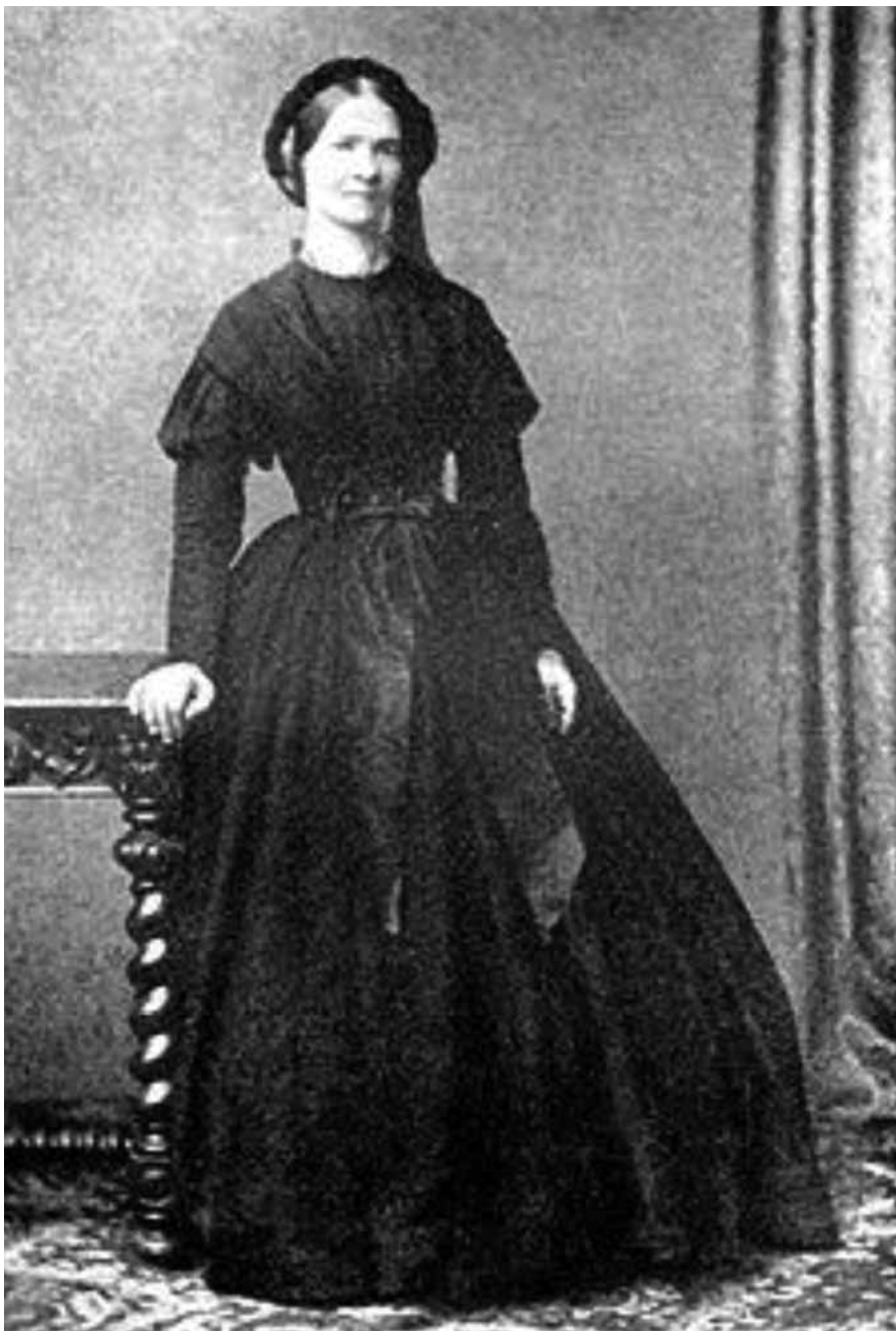
1. Narcyza Żmichowska w okresie żałoby narodowej