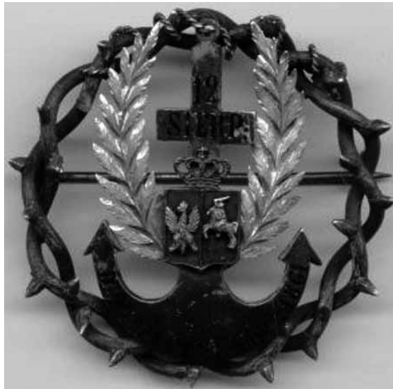
7. Brosza żelazna z motywami kotwicy, krzyża i korony cierniowej, wykonana na pamiątkę manifestacji w dniach 25 i 27 lutego 1861 roku, kolorowe emalie zostały użyte do zaznaczenia kolorystyki herbów Księstwa i Pogoni, a złoto do wyróżnienia motywu lauru, lata 60. XIX wieku