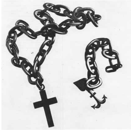
4. Komplet biżuterii żałobnej: naszyjnik i bransoleta w formie łańcucha, z wisiorami w kształcie krzyżyka, serca i kotwicy, wykonane w czarnej lacy, lata 60. XIX wieku, własność Muzeum Niepodległości