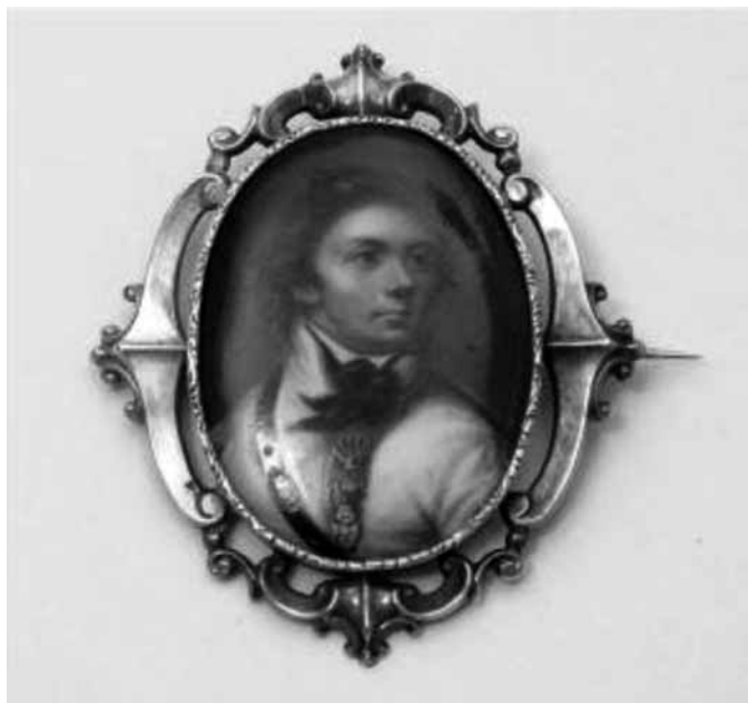
3. Brosza z portretem miniaturowym Tadeusza Kościuszki z połowy XIX wieku, obecnie w zbiorach Muzeum w Gliwicach