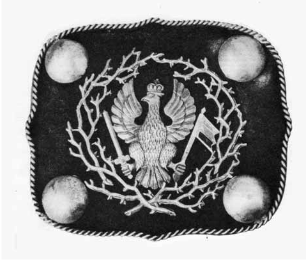
8. Klamra do paska, srebro, emalia, aksamit, lata 60. XIX wieku, z kolekcji prywatnej