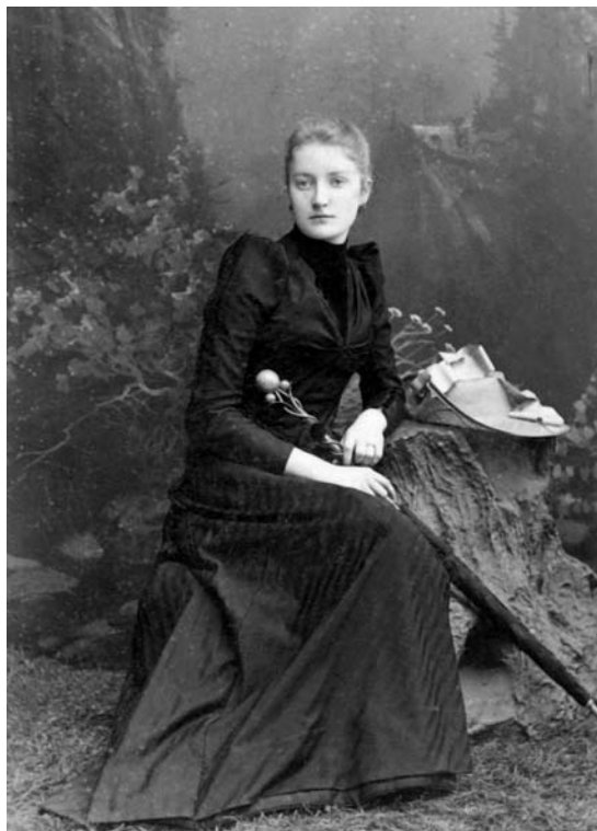
Portret Marii Kelles-Krauzowej (1873–1943). Fot. z 1890 r. pochodzi ze zbiorów Biblioteki Narodowej (Cyfrowa Biblioteka Narodowa Polona)

w 1931 roku uprawnień do ulgowych przejazdów kolejowych dla uczniów szkoły 22 . Co więcej, polskie Ministerstwo Kultury i Sztuki w 1954 roku uznawało świadectwo ukończenia Zakładu Muzycznego Malwiny Reissówny za dowód ukończenia niepełnych wyższych studiów artystycznych 23 .