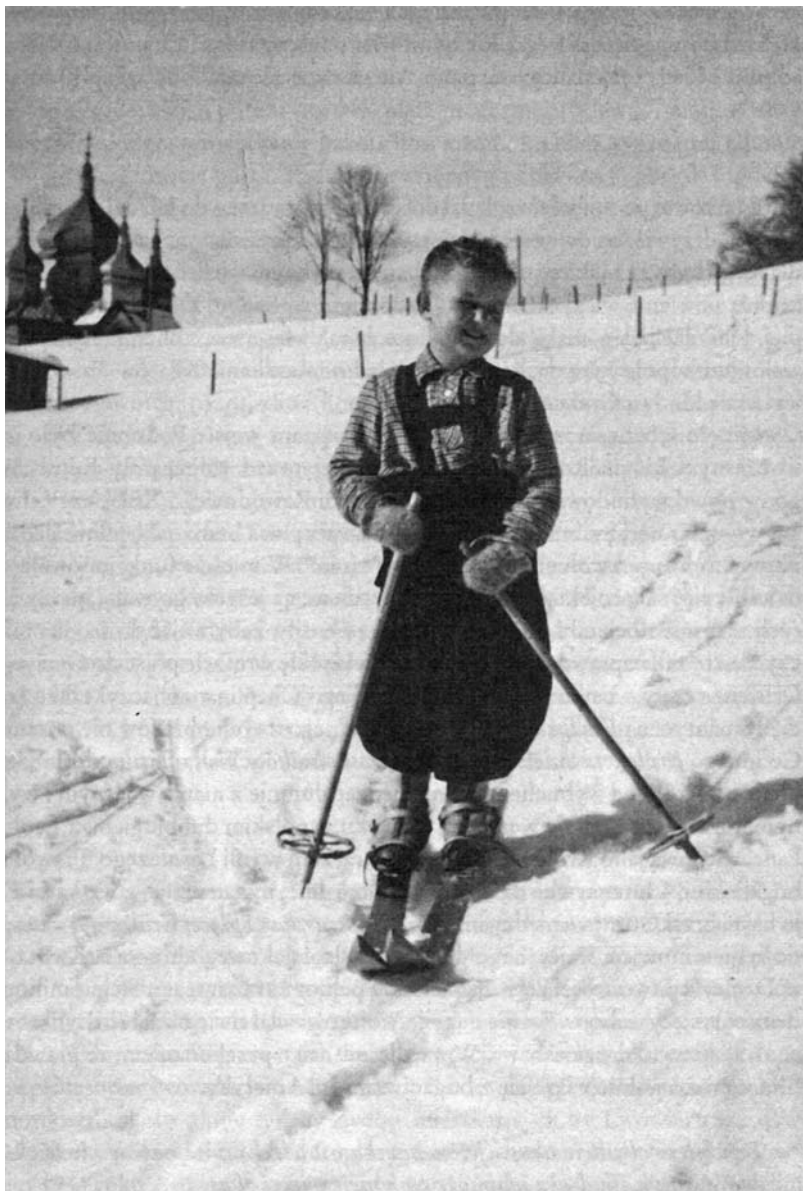
Wojciech Kilar na zimowych wakacjach w Worochcie na Pokuciu w województwie stanisławowskim. Fot. przed 1939 r. pochodzi z: M. Wilczek-Krupa, Kilar. Geniusz o dwóch twarzach , Kraków 2015, s. 25.