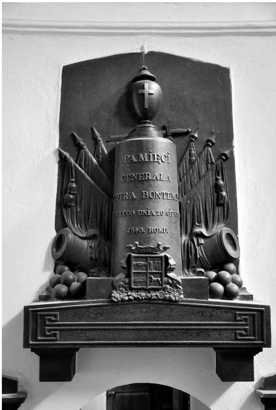
Epitafium Piotra Bontempsa w kościele Braci Mniejszych Kapucynów przy ul. Miodowej w Warszawie.