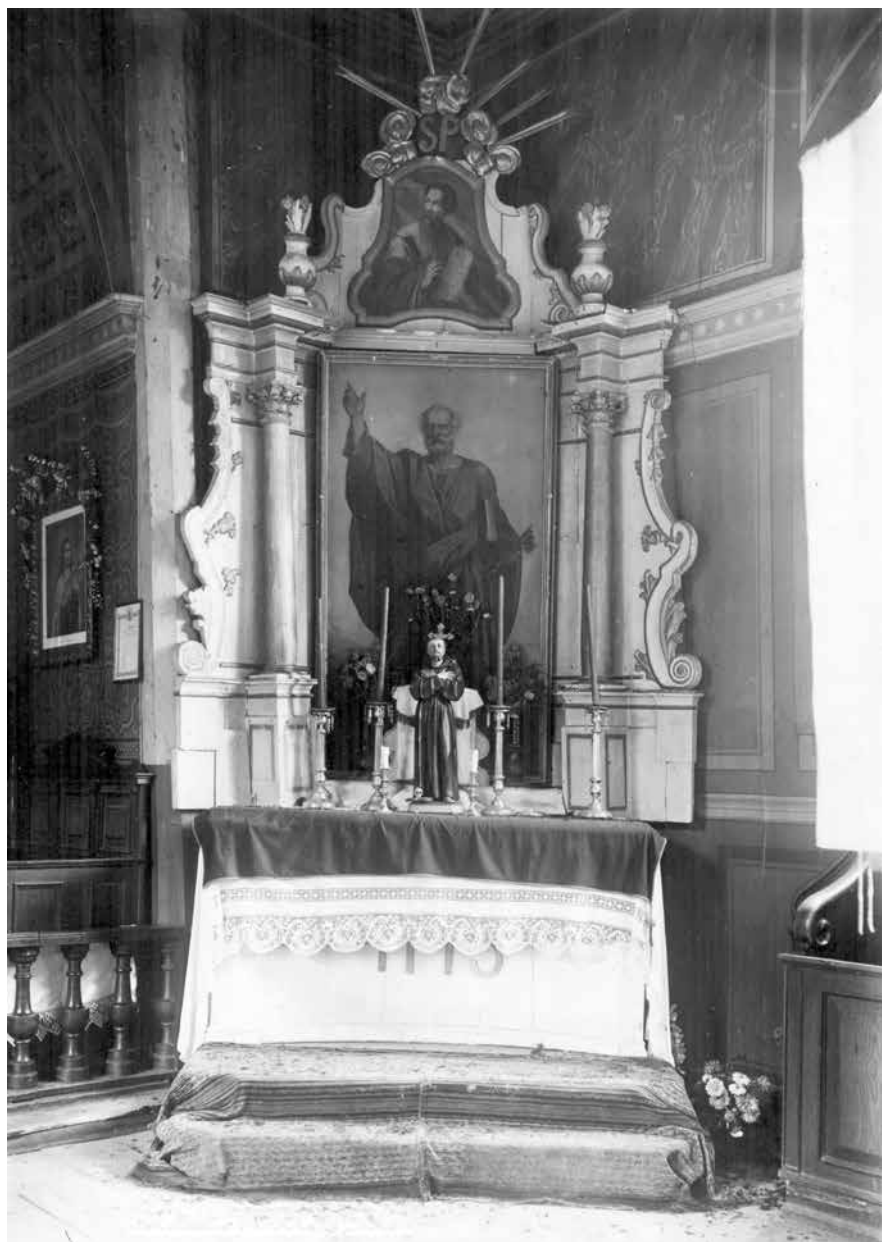
Obraz św. Piotra Apostoła ufundowany przez generałową Bontemps, znajdujący się w bocznym ołtarzu kościoła św. Jakuba w Imielnicy.