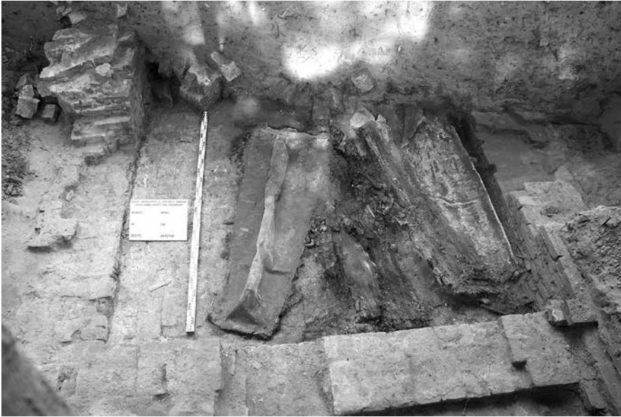
Trumny ze szczątkami Piotra Bontemps (po prawej) i jego żony Róży Eleonory z d. Monfreulle (po lewej), odsłonięte podczas badań archeologicznych Muzeum Mazowieckiego w Płocku w 2013 r.

o długości boku ok. 3 m. Prawdopodobnie sklepienie wewnątrz nie było wysokie – do 1,5 m. Posadzka była ceglana, z cienką wylewką pomalowaną na niebiesko(?). Wejście do niej znajdowało się prawdopodobnie na wprost prezbiterium (sugeruje to układ trumien w krypcie). Na posadzce spoczywały dwie trumny. Nie zajmowały one całej powierzchni pomieszczenia, część południowa była wolna, być może przeznaczono ją na kolejny pochówek kogoś z rodziny. W centralnej części krypty spoczywała Róża Eleonora Bontemps (wg identyfikacji antropologicznej – kobieta zmarła w wieku 60–70 lat). Obok niej, wzdłuż północnej ściany krypty, leżała trumna generała Piotra Bontemps (mężczyzna, 60–70 lat). Obydwa pochówki nosiły ślady ludzkiej ingerencji, na szczęście niezbyt dużej, mającej miejsce najprawdopodobniej w czasie rozbiórki kościoła w 1935 roku. Zapewne chciano się wtedy przekonać kto spoczywa w krypcie.