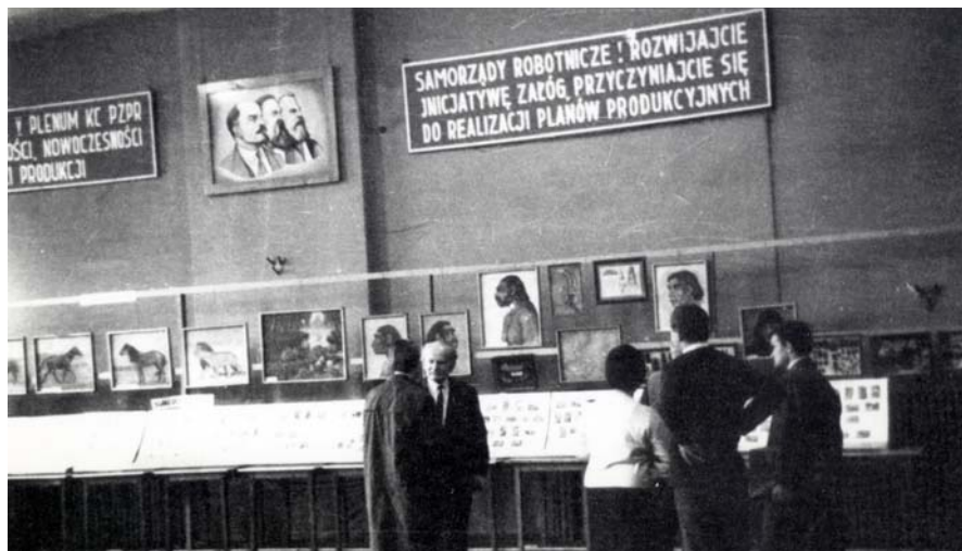
Fragment wystawy czasowej pt. „Powstanie i rozwój życia na ziemi” (1952)