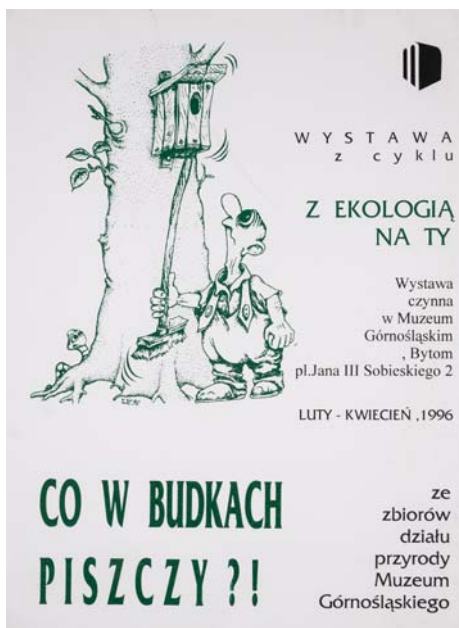
Wystawa z cyklu „Z ekologią na ty” – „Co w budkach piszczy?! (luty–kwiecień 1996)