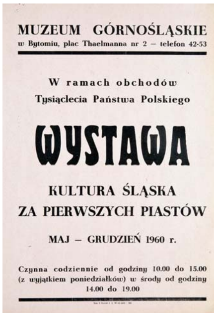
Wystawa pt. „Kultura śląska za pierwszych Piastów” (1960)