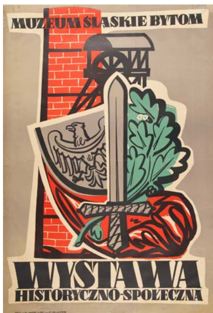
„Wystawa historyczno-społeczna” (1949)