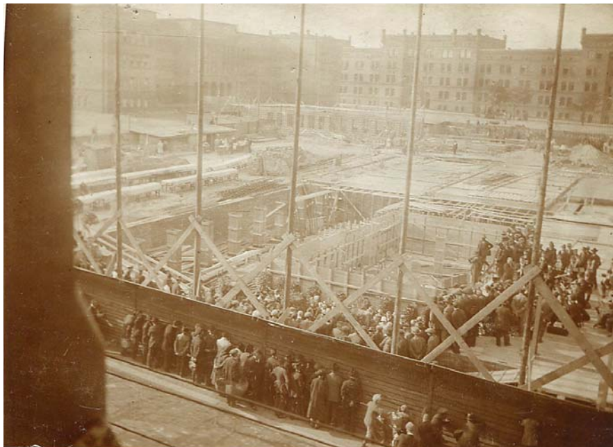
Uroczystość wmurowania kamienia węgielnego pod nowy budynek muzeum (18 czerwca 1929)