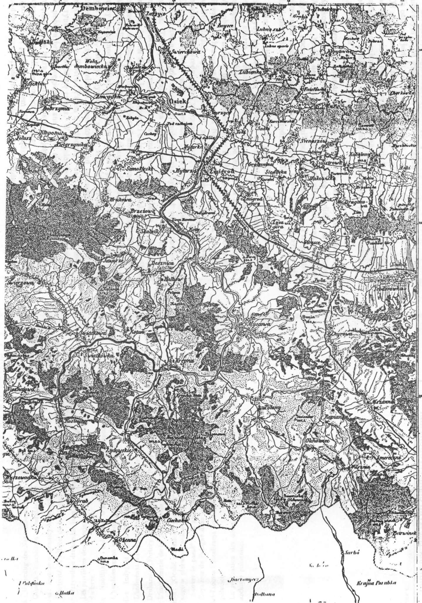
Ryc. 1. Fragment mapy C. Kummersberg a Un fragment d'une carte de C. Kummersberg