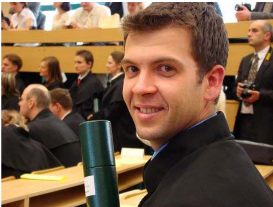
Zdjęcie 12. Po promocji – uśmiechanie się, szczęśliwa twarz, szczęście.

10/ Pewną logiczną kontynuacją wcześniej przedstawionej rodziny jest Rodzina , tzw., „jednostek społecznych” ( unit family , Glaser, 79-80). Pomimo faktu, iż terminy tej rodziny sprawiają wrażenie bycia pewnymi strukturalnymi etykietkami, z założenia nie są one jednak strukturalne. „Jednostki społeczne” jako grupy są częścią pewnego zjawiska, poddawanego zmianom oraz procesom. Biorąc pod