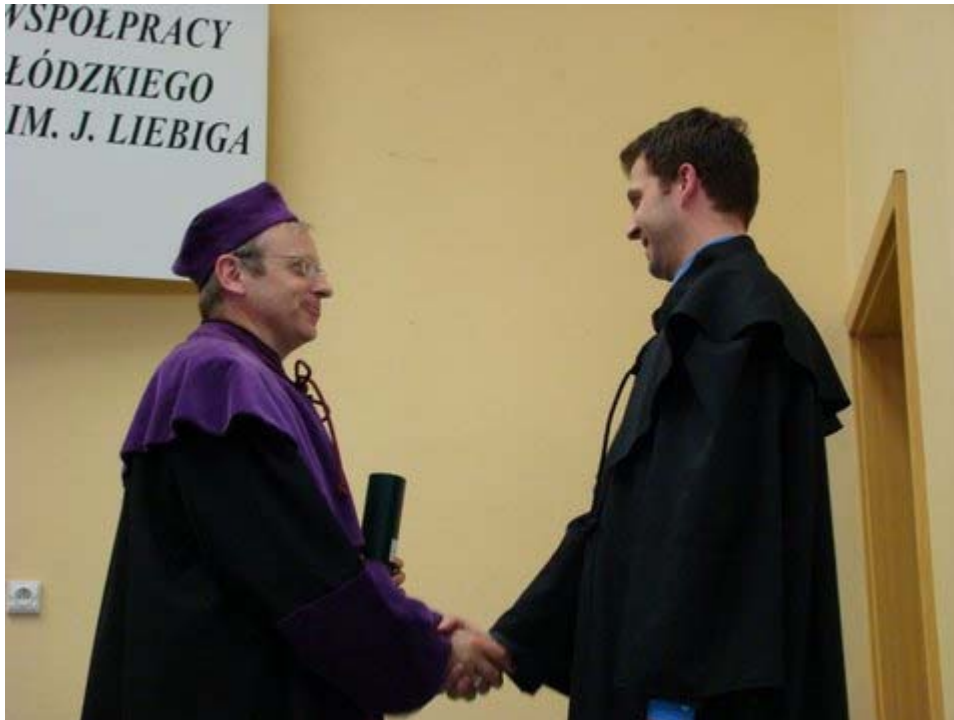
Zdjęcie 11. Podczas promocji – punkt zwrotny; zmiana statusu, mobilność społeczna.