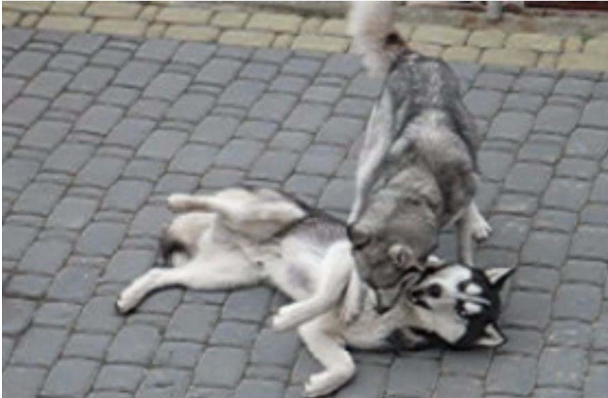
Zdjęcie 1. Pies bawi się, a nie walczy - zabawa psów, udawana walka; środkowa faza zabawy (zdjęcie z nagrań video, badania na temat interakcji zwierząt i ludzi, Konecki, 2008).

obrazie, bez etnograficznej wiedzy na temat kontekstu, jest niezwykle trudne. Obraz jest stały i zaobserwować możemy jedynie jeden etap danego wydarzenia bądź wydarzenie, które jest niezwykle trudne do zrozumienia w kontekście tego, jakie stadium wskazuje albo, jakiego typu zachowanie jest przez nas obserwowane (zobacz Zdjęcie 1 poniżej: Pies bawi się, a nie walczy ).