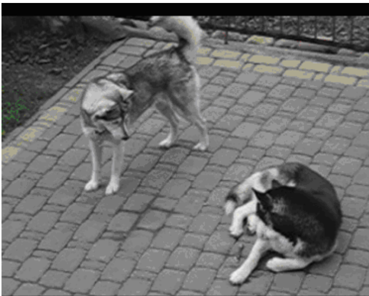
Zdjęcie 2. Przygotowanie do zabawy, początek sekwencji (zdjęcie z nagrań video, badania na temat interakcji zwierząt i ludzi, Konecki 2008).

Możemy zatem zidentyfikować dane stadia jeżeli tylko posiadamy sekwencję analizowanych obrazów bądź nagrania video (zobacz Zdjęcie 2 poniżej). Jeśli widzimy jakieś znaki zabawy na początku interakcji (Zdjęcie 2), możemy wnioskować, co będzie się działo dalej w przypadku tej samej interakcji (Zdjęcie 1). Rozumienie sytuacji wywodzi się zatem z sekwencji tego zdjęcia, gdzie znaczenie generujemy w oparciu o obserwację rozwoju procesu krok po kroku.