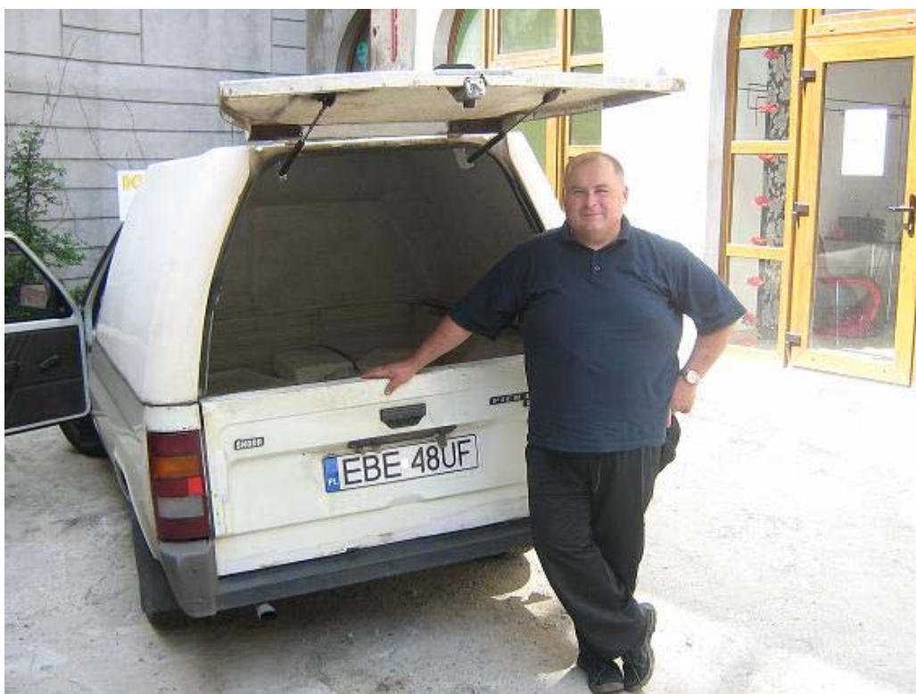
Zdjęcie nr 2: Eko-rolnik