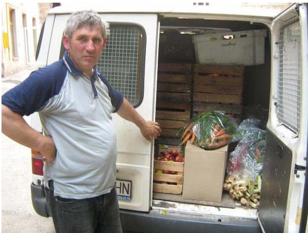
Zdjęcie nr 1: Eko-rolnik