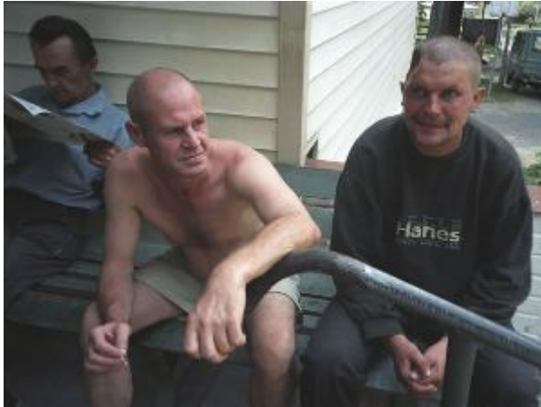
Fotografia 5. „Atmosfera czekania”; odpoczywanie – na ławce, ławkowanie, Miejsce siedzenia

„Jedzenie i spanie” są własnościami „atmosfery czekania” (patrz zdjęcie 6). „Atmosfera czekania” z kolei jest prawdopodobnie własnością „atmosfery życia bezdomnych”. Na omawianym zdjęciu nie ma wyraźnej opozycji, kontrastowania. Świat bezdomności jest wewnątrznie spójny i życie toczy się powoli i „spokojnie”.