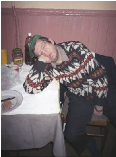
Fotografia 6. Bezdomny śpiący na stole. „atmosfera czekania”, jedzenie, „jedzenie i spanie”

„Jedzenie i spanie” są własnościami „atmosfery czekania” (patrz zdjęcie 6). „Atmosfera czekania” z kolei jest prawdopodobnie własnością „atmosfery życia bezdomnych”. Na omawianym zdjęciu nie ma wyraźnej opozycji, kontrastowania. Świat bezdomności jest wewnątrznie spójny i życie toczy się powoli i „spokojnie”.