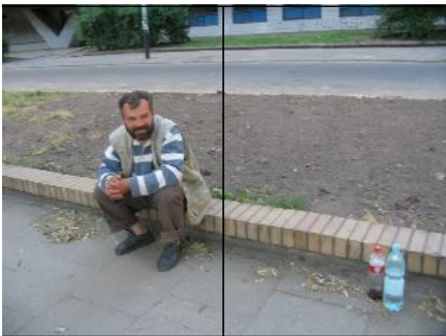
Fotografia 26. Bezdomny siedzący na krawężniku. Fotograf był trochę zakłopotany fotografowaniem i wykonał zdjęcie bardzo szybko nie ogniskując fotografii na twarzy bezdomnego (bezdomni żyjący poza schroniskiem; fotografia z własnego projektu badawczego).