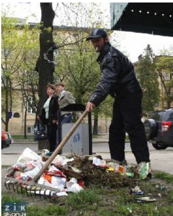
Fotografia 1. Grabienie śmieci; praca. Kontrastowanie 7

Zdjęcie zostało zrobione z „niskiej” perspektywy, śmieci są na pierwszym planie. W tle widzimy tak zwanych „normalnych” ludzi i samochody (jeden z nich to raczej drogi terenowy samochód marki Suzuki). To, co widzimy na zdjęciu jest elementem procesu, który może zostać nazwanym „kontrastowaniem”. Być może fotograf, razem z widzem (analitykiem) kontrastuje na zdjęciu to, co już jest społecznie skontrastowane. Normalne życie i dobrobyt na tle biedy. Przynajmniej na zdjęciu świat społeczny jest pokazany z tej perspektywy. Widzimy opozycję „bezdumni – normalni” co też jest elementem wizualnego procesu kontrastowania.