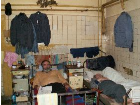
Fotografia 14. Życie w schronisku; problem prywatności; prywatna i publiczna przestrzeń; brak przestrzeni – ciasnota; łóżko; łózkowanie (fotografia z własnego projektu badawczego, Schronisko Towarzystwa im. Świętego Brata Alberta w Łodzi).