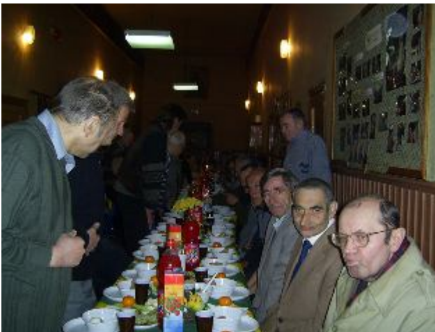
Fotografia 13. Życie w schronisku. Świątowanie Wielkiej Nocy. Stół i miejsce celebracji święta. Zorganizowane świątowanie. Świątowanie i koncentracja na żywności.