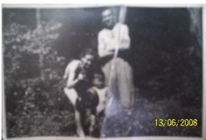
Fotografia 30. Fotografia fotografii z „poprzedniego życia” (perspektywa przeszłościowa; fotografia z własnego projektu badawczego).