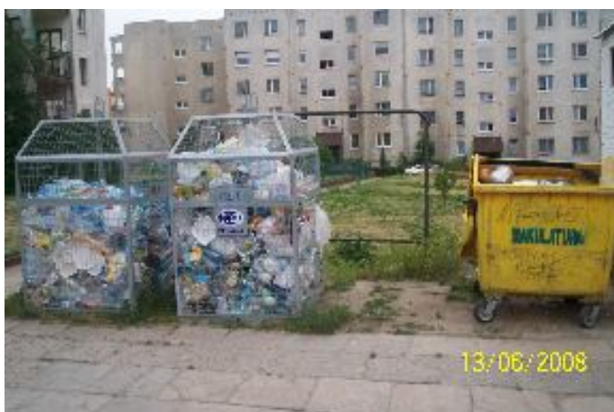
Fotografia 31. Rzeczywistość zamieszkiwania na ulicy. Perspektywa terażniejszości. Praca na śmietnikach (fotografia z własnego projektu badawczego)