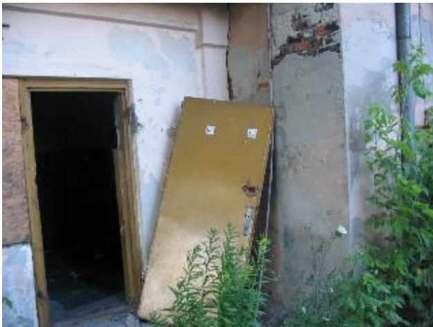
Fotografia 19. Miejsce zamieszkiwania bezdomnych – wędrujących. Ruiny w pobliżu stacji kolejowej Łódź Fabryczna (fotografia z własnego projektu badawczego).

Chcąc odpowiedzieć na powyższe pytania studenci wyszli w teren do bezdomnych przebywających poza schroniskami. Fotografie przez nich wykonane poniżej pokazują miejsca przebywania i „zamieszkiwania” przez bezdomnych - wędrujących, przebywających poza schroniskiem.