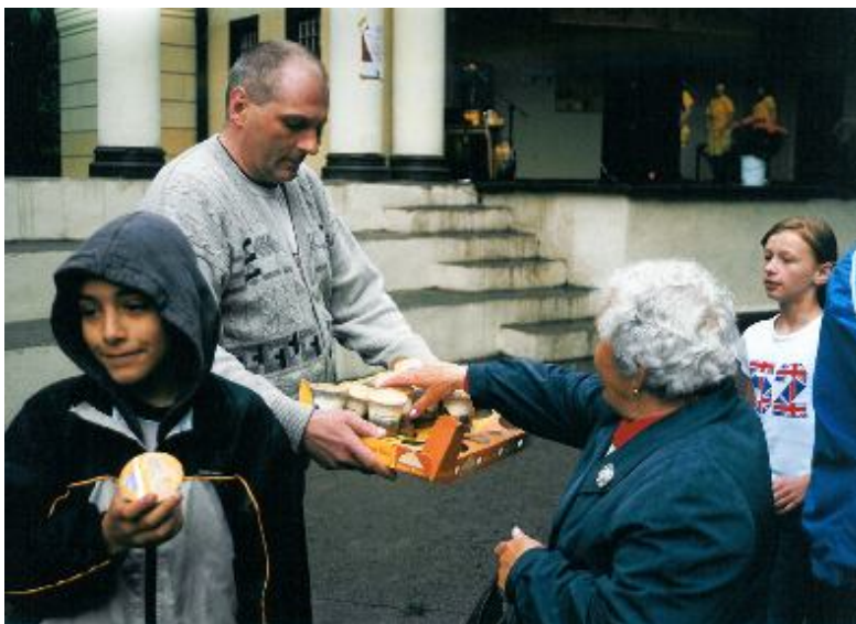
Fotografia 9. Koncentracja na jedzeniu