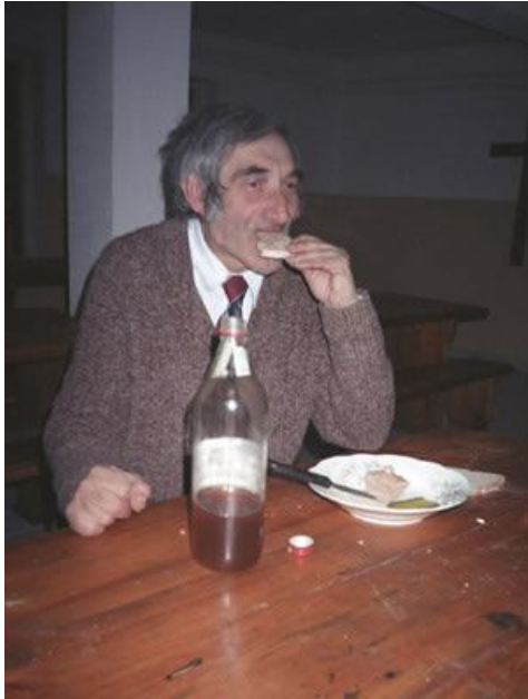
Fotografia 8. Koncentracja na jedzeniu. Jedzenie