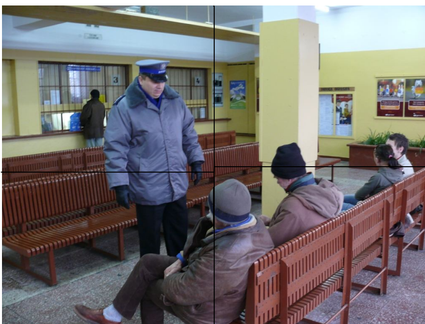
Fotografia 3. "Kontrastowanie" na dworcu; ławka; ławkowanie

"Wizualne kontrastowanie" oficjalnych przedstawicieli prawa z osobami wyglądającymi na bezdomnych jest widoczne na zdjęciu 3. Prawie jedną czwartą zdjęcia zajmuje sylwetka policjanta i jego osobista przestrzeń. Policjant stoi i patrzy na dwie osoby siedzące na ławce, na dworcu. Jeden z nich ma spuszczoną głowę i patrzy w dół, prawdopodobnie szukając dokumentów. Po prawej stronie widzimy "normalnych ludzi", również siedzących, ale na innej ławce. Między nimi stoi słup przydający znaczenie oddzielenia. Widzimy przestrzeń dzielącą dwa światy,