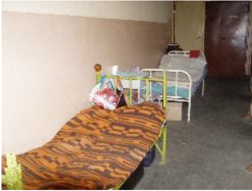
Fotografia 16. Prywatna przestrzeń; własność; centrum prywatnego życia; miejsce łóżkowania (fotografia z własnego projektu badawczego, Schronisko Towarzystwa im Świętego Brata Alberta w Łodzi).