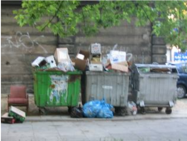
Fotografia 25. Śmietniki dają możliwość uzyskania rzeczy wartościowych i wymiernych na pieniądze; miejsce pracy bezdomnych (bezdomni żyjący poza schroniskiem; fotografia z własnego projektu badawczego).