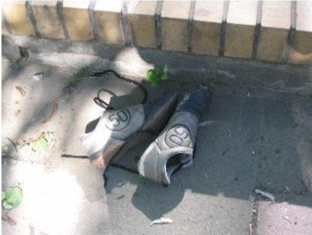
Fotografia 22. Buty. („Mogą się przydać, znalazłem je dzisiaj” (fotografia z własnego projektu badawczego, bezdomny żyjący poza schroniskiem).