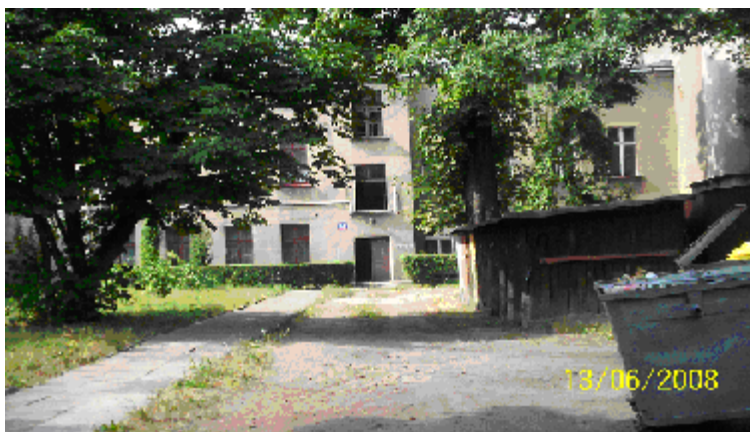
Fotografia 29. Miejsce gdzie bezdomny mieszkał poprzednio (perspektywa przeszłościowa; fotografia z własnego projektu badawczego).