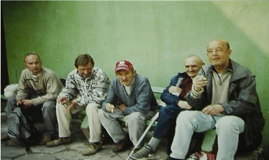
Fotografia 7. Siedzenie na ławce. Ławkowanie. Miejsce czekania. Grupy charakter „atmosfery czekania”. Odpoczywanie – palenie. Bezdomni w różnym wieku, lekko uśmiechnięci, pochylający ciało do przodu, trzymający łokcie na kolanach lub udach. ( http://www.ltf.com.pl/wystawy_w_galerii/w_o_obiektyw_bezdomnego.html )

z upływającym czasem, który dany jest naocznie i bezpośrednio jest trudnym zadaniem – „trzeba zabić jakoś ten czas” (zob. fotografię 38 w Załącznikach) 9 . To siedzenie i czekanie zawsze (na fotografiach) jest związane z pochylaniem ciała do przodu i trzymaniem łokci na kolanach lub udach. Taka pozycja daje wrażenie zmęczenia, rezygnacji, brak jest uśmiechu lub jest on ledwie zaznaczony. Nie ma zdjęcia pokazującego bezdomnego siedzącego prosto, bez podparcia o kolana lub uda, z pełnym oparciem o poręcz krzesła lub ławki. Być może jest to związane z ergonomią siedzenia, ale sądzimy, że ma to związek z ich sytuacją życiową i niepewnością odnośnie aktualnej sytuacji. Jest to pewien choreograficzny idiom ciała ukazujący ich aktualną tożsamość w trakcie fotografowania.