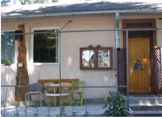
Fotografia 36. Miejsce lokalizacji klubu fotograficznego i miejsce zamieszkiwania bezdomnego mężczyzny, który jest dumny ze swoich dokonań odnośnie chodnika i stawu (perspektywa terażniejszości; fotografia z własnego projektu badawczego).