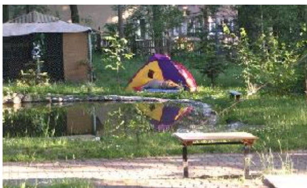
Fotografia 35. Kostka w chodnikach i staw przed schroniskiem skonstruowany przez bezdomnego. Duma w czasie teraźniejszym (podczas wykonywania fotografii badacz nieintencjonalnie uchwycił także namiot przed którym jeden z bezdomnych aktualnie spał; (perspektywa teraźniejszości; fotografia z własnego projektu badawczego)

Bezdomni mogą także pokazać przedmioty lub elementy otoczenia, z których są dumni, na przykład sadzawka przed schroniskiem, która została przez bezdomnego skonstruowana. To jest duma osadzona w teraźniejszości, chociaż sadzawka została stworzona wiele lat temu (zdjęcie 35). Bezdomny mężczyzna zrobił pewne niejasne uwagi dotyczące przyszłości, że pewna kobieta zamierza zabrać go do Włoch; jego uwagi wydały się być fantastyczne.