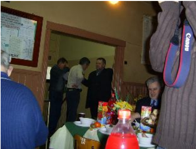
Fotografia 4. Kontrastowanie; drzwi jako linia podziału między sceną i kulisami; jedzenie; praca fotografa; świętowanie Wielkanocy ( http://www.bezdomni.ovh.org/easter.html )

„normalni ludzie” siedzą osobno w pewnym oddaleniu od bezdomnych. Na zdjęciu widzimy również „normalnego” mężczyznę kupującego bilet w kasie. Po raz kolejny mamy do czynienia z bezdomnymi otoczonymi przez tak zwany normalny świat. Kontrastowanie zostało głównie pokazane przez wykadrowanie zdjęcia na policjanta, który prawdopodobnie prosi bezdomnego mężczyznę o dokumenty. Policjant jest główną postacią na zdjęciu, reprezentuje on oficjalny świat. Bezdomni są natomiast „wyrzutkami” kontrolowanymi ponieważ nie mają domu i są łatwo rozpoznawalni nie tylko przez policję. Ta rozpoznawalność dotyczy pewnych cech wyglądu i zachowań. Na fotografii niekoniecznie muszą siedzieć bezdomni, ale tak wyglądają i tak zostali rozpoznani przez analizujących sytuację studentów. Na zdjęciu możemy zaobserwować ponadto opozycję stania – siedzenie (policjant – bezdomny).