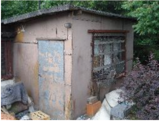
Fotografia 18. Miejsce przebywania bezdomnych – wędrujących, komórka na działce (fotografia z własnego projektu badawczego).

Chcąc odpowiedzieć na powyższe pytania studenci wyszli w teren do bezdomnych przebywających poza schroniskami. Fotografie przez nich wykonane poniżej pokazują miejsca przebywania i „zamieszkiwania” przez bezdomnych - wędrujących, przebywających poza schroniskiem.