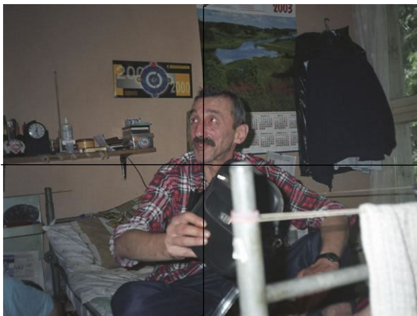
Fotografia 10. Bezdomny siedzący na łóżku z torbą; łózkowanie; bycie zamkniętym w przestrzeni - ciasnota

Przestrzeń prywatna jest zmieszana z publiczną. Bezdomni mają niewielkie szanse na utrzymanie swoich prywatnych rzeczy z dala od oczu innych osób. Jediną zamkniętą prywatną przestrzenią jest torba, którą bezdomny trzyma w rękach. Reszta przedmiotów, nawet tych umieszczonych daleko od obiektywu, jest dostępna i możliwa do zaobserwowania dla innych, co zostało udokumentowane na fotografii.