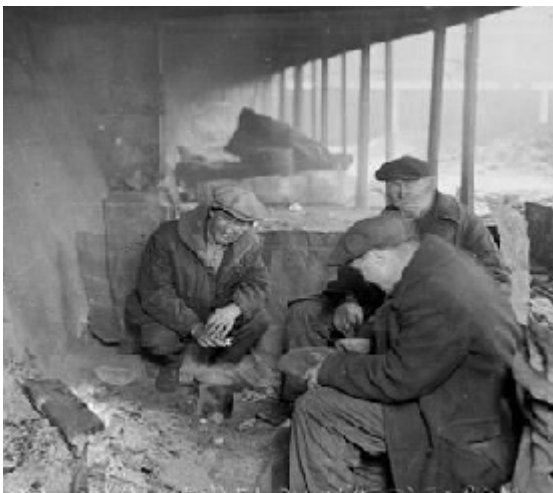
Fotografia 17. Trzej bezdomni – wędrujący ( hobos), Chicago, 1929.

Jednakże opisywane przez nas dotychczas fizyczne warunki życia związane są z mieszkaniem w schronisku lub noclegowni. Jeśli wyjdziemy w swych badaniach poza schronisko do innego miejsca zamieszkania bezdomnych, możemy zobaczyć inne strony ich życia codziennego, na przykład miejsce zamieszkania w porzuconych budynkach, lub jak bezdomni przyrządzają jedzenie w ruinach? Jak są ubrani kiedy jest zimno i czy zniszczony dom może ich chronić przed zimnem?