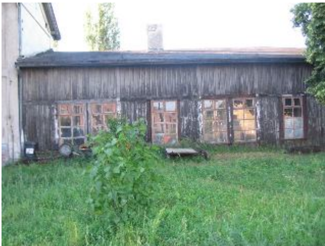
Fotografia 23. Komórki w pobliżu stacji kolejowej. Miejsce „zamieszkiwania” (bezdomni żyjący poza schroniskiem; fotografia z własnego projektu badawczego).