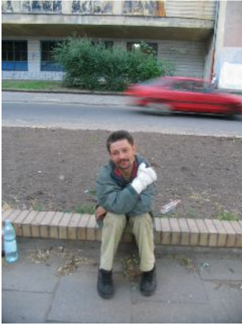
Fotografia 21. Bezdomny mężczyzna, krawężnik, krawężnikowanie, butelka wódki; w pobliżu Wydziału Ekonomiczno – Socjologicznego UŁ (fotografia z własnego projektu badawczego).

Nasycenie kategorii własnościami pochodzącymi z obrazów powinno się zazwyczaj odnosić do danych werbalnych. Powinniśmy zdobyć pewne dane bezpośrednio od bezdomnych aby zrozumieć znaczenia fizycznych warunków życia. Duża część zdjęć, które analizowaliśmy ze studentami, została wykonana przez bezdomnych i znaczenie warunków życia jest zapisane właśnie w reprezentowanych przez zdjęcia fizycznych przedmiotach i przestrzeni. Bezdumni fotografowie oraz „bezdumni kierujący fotografiami” wybrali to, co chcieli pokazać innym (studentom – badaczom), co jest dla nich ważne, jak czują i co robią w określonych miejscach.