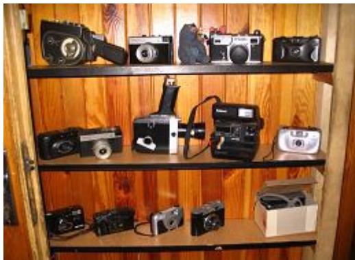
Fotografia 34. Kolekcja aparatów fotograficznych i kamer; klub fotograficzny w schronisku; czas teraźniejszy; fotografowanie (fotografia z własnego projektu badawczego).

Aktualne (teraźniejszość) warunki życia są również kojarzone z pewnymi czynnościami, które są wykonywane w schronisku. W jednym z łódzkich schronisk jest klub fotograficzny i bezdomni mężczyźni wskazują na kolekcję zdjęć zaprezentowanych na półce (zdjęcie 34), niedaleko miejsca, gdzie aktualnie mieszka (zdjęcie 36).