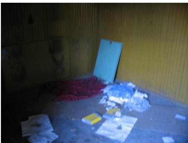
Fotografia 20. Miejsce spędzania czasu podczas deszczu i zimnej pogody w nocy i miejsce na spożywanie alkoholu (fotografia z własnego projektu badawczego).