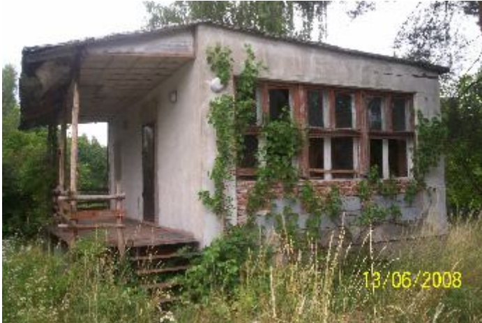
Fotografia 32. Przyszłe miejsce „zamieszkania” – perspektywa przyszłościowa (fotografia z własnego projektu badawczego).

Jak zostało wspomniane, bezdomni pokazują przede wszystkim miejsca i ikony z ich obecnego życia. Są oni zanurzeni w teraźniejszości. Niektórzy z nich pokazują miejsca, w których spędzają większość swojego czasu: