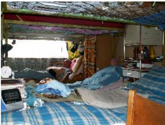
Fotografia 15. Życie w schronisku; prywatna i publiczna przestrzeń; brak przestrzeni – ciasnota; łóżko; łózkowanie, prywatna własność (fotografia z własnego projektu badawczego, Schronisko Towarzystwa im Świętego Brata Alberta w Łodzi).

Fotografie 14 i 15 wskazują na własność „brak przestrzeni – ciasnota”. Możemy znaleźć więcej fotografii, które wskazują na brak przestrzeni w schronisku. Wszystkie fotografie ze schronisk pokazują przedmioty, które są własnością bezdomnych w pobliżu ich łóżek a nawet na ich łózkach. W pokojach w wyżej pokazywanym schronisku śpi po czternaście osób i „każdy chciałby mieć własny pokój”, jak powiedział jeden z rozmówców.