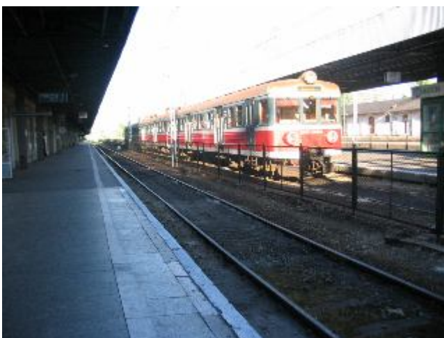
Fotografia 24. Stacja kolejowa Łódź Fabryczna. Miejsce pobytu i życia bezdomnych (bezdomni żyjący poza schroniskiem; fotografia z własnego projektu badawczego).