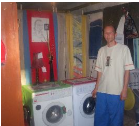
Fotografia 33. Najbardziej ulubione miejsce w czasie teraźniejszym, pralnia. Brak odniesień do przeszłości i przyszłości.

Wizualne obrazy są współtworzone razem z informatorami, widzimy z sekwencji wypowiedzi i ich komentarzy, że bezdomni mężczyźni nie mają doświadczenia z takimi pytaniami i problemami na temat kontrastowania wymiarów czasowych. Jednakże bezdomny ze schroniska odpowiedział i pokazał miejsce, które jest dla niego obecnie bardzo ważne (zdjęcie 33).