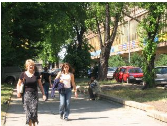
Fotografia 27. Bezdomny siedzący na krawężniku; miejsce w pobliżu Wydziału Ekonomiczno – Socjologicznego UŁ (bezdomni żyjący poza schroniskiem; fotografia z własnego projektu badawczego).