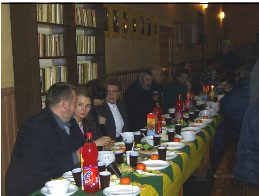
Fotografia 2. Wielkanoc w schronisku, świętowanie Wielkanocy. Kontrastowanie 8