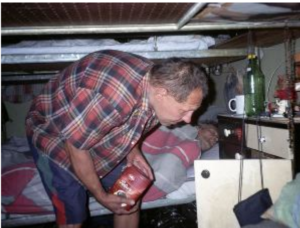
Fotografia 12. Brak przestrzeni – ciasnota; żywność; prywatne przedmioty; ozdoby.

Omawiana kategoria jest połączona z przykładami, które wskazują na następujące własności: „koncentracja na pożywieniu” (zdjęcie 8, 9, 13), brak podziału na prywatną i publiczną przestrzeń (zdjęcie 10, zob. także nota do zdjęcia 10, oraz fotografie 12,14), „miejsce na odpoczynek” (zdjęcie 5,7), jedzenie (zdjęcie 6,12), „brak przestrzeni - ciasnota” (zdjęcie 12,15), miejsce ucztowania (zdjęcie 2,13); miejsce ławkowania i łózkowania” (ławka, zdjęcie 5, łóżko, zdjęcie 15,17), brak osobistych przedmiotów i własności prywatnej (dane z wywiadów).