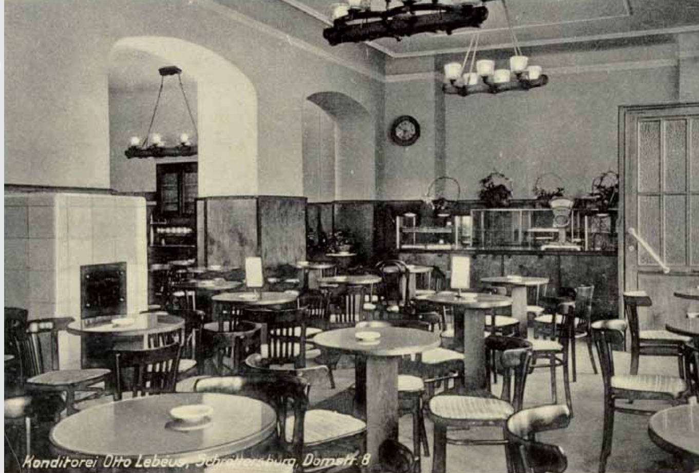
Wnętrze cukierni w latach drugiej wojny światowej.

➔ Na widokówce z ok. 1914 r. (na stronie obok) widzimy przed secesyjnym budynkiem, gdzie mieściła się cukiernia, zadaszony ogródek konsumpcyjny.