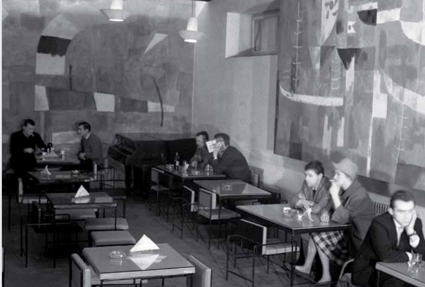
Wnętrze kawiarni Teatralna w latach 60. XX wieku.

KAMIENICA SECESYJNA PRZY TOMSKIEJ 8, OK. 1914 R.