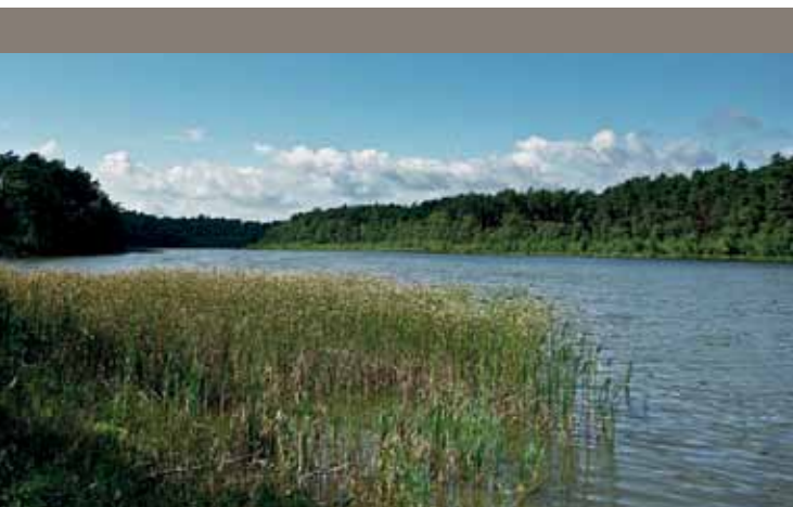
Fragment rezerwatu Gościąg, utworzonego w 2000 r. dla zachowania w celach edukacyjnych i krajobrazowych jeziora Gościąg, w którym zalegają osady niezaburzone od 12 000 lat

Dawne prawo łowieckie niewątpliwie przyczyniło się do ochrony rzadszych, a także szczególnie cennych z gospodarczego punktu widzenia gatunków zwierząt. Te ostatnie stanowiły przedmiot monarszego monopolu (regale) łowieckiego. Z czasem jego skuteczność stawała się coraz mniejsza. To właśnie na Mazowszu rozegrała się jedna z najtrudniejszych, niestety przegranych, batalii o ocalenie ginącego gatunku. W ostępach Puszczy Jaktorowskiej (obecnie jej resztki znajdują się na południowy zachód od Żyrardowa i na północ od Radziejowic), jeszcze w początkach epoki nowożytnej, można było stanąć oko w oko z potężnym turem, któremu nadano status zwierzęcia „głównego i patriarchalnego”. Nie uchroniło to jednak tego szanowanego zwierzęcia przed tragicznym końcem. W 1627 r. w Puszczy Jaktorowskiej, w okolicach Warszawy, zginęła ostatnia samica tura. Nawet zarządzenie króla Zygmunta III Wazy, obejmujące tury ostrymi rygorami ochronnymi, nie ocaliło gatunku przed wyginięciem. Wypada jednak podkreślić, iż mazowieckie puszcze stanowiły ostatnią światową ostoję tego wspaniałego zwierzęcia.