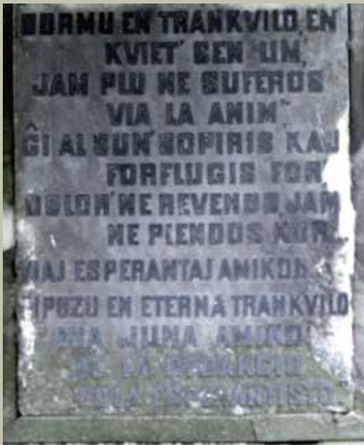
Przednia strona tablicy nagrobnej z inskrypcją w języku esperanto.