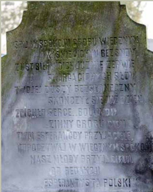
Tylna strona tablicy nagrobnej z inskrypcją w języku polskim.