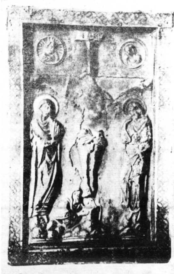
Oprawa Ewangeliarza Anastazji

Nazwa „Ewangeliarz Anastazji” łączona jest z imieniem poślubionej w r. 1137 przez Bolesława Kędzierzawego Wierzchosławy, księżniczki ruskiej, córki nowogrodzkiego księcia Wsiewołodymira. 8)