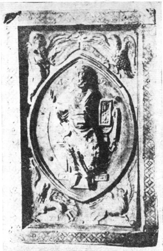
Oprawa Ewangeliarza Anastazji Tylne strona okładki