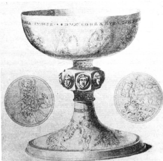
Kielich Konrada Mazowieckiego