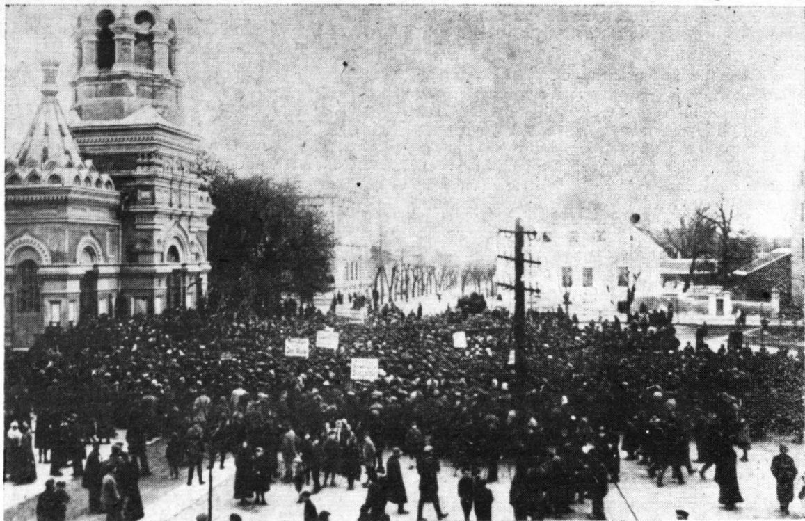
1-Majowy pochód w Płocku w 1919 roku