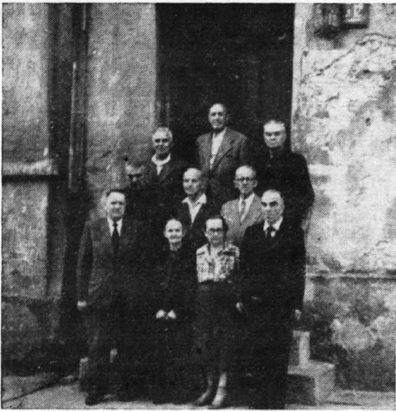
Działacze Klubu Robotniczego im. Rechniewskiego