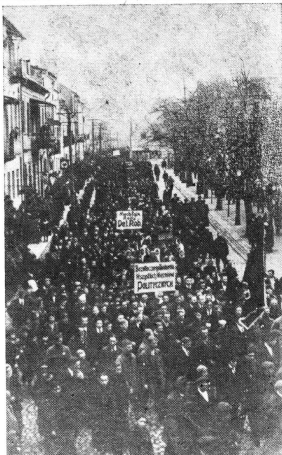
Demonstracja 1-Majowa w Płocku

Nieustannym bodźcem była pamięć o 2 lipca wzmacniana przez manifestację bezrobotnych w okręgu. Tak więc w listopadzie doszło do burzliwej demonstracji w Rypinie pod hasłem „Nie chcemy morzyć dzieci głodem”.