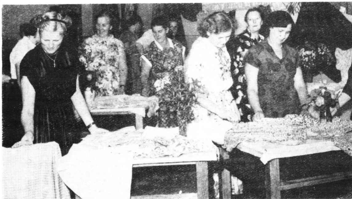
Przeгляд wykonanych prac na jednym z licznych kursów kroju i szycia, organizowanych po wojnie przez spółdzielnię

W 1969 roku przewidziane jest urządzenie 2 wycieczek krajoznawczych, 3 świąteczne dla 300 dzieci członków, 2 imprezy dla 700 dzieci, 15 odczytów i pogadek, 20 wieczorów świetlicowych, 200 pokazów i kilkanaście różnych imprez z okazji XXV-lecia PRL i 100-lecia istnienia w Polsce Spółdzielni Spożywców.