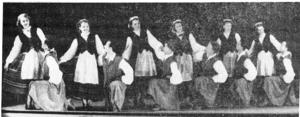
Spółdzielczy Zespół Pieśni i Tańca na scenie teatru płockiego

W 1955 roku na zakup kostiumów dla powstających zespołów: tanecznego, chóralnego i muzycznego oraz na zakup instrumentów mu-