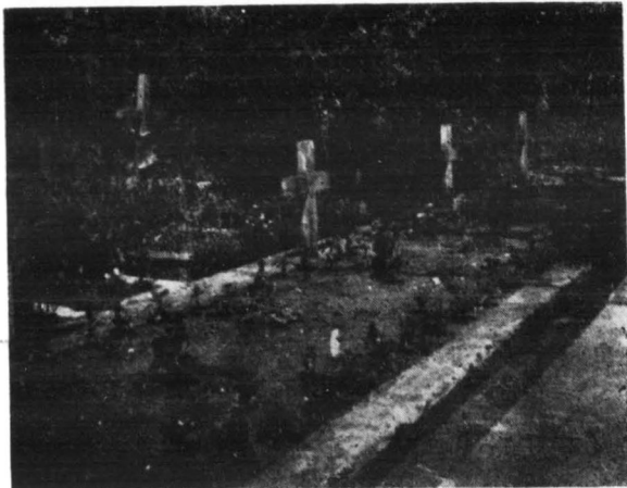
Żołnierskie groby na cmentarzu w Gąbinie

Ku czci poległych wystawiono pomnik. Na wielu mogiłach wryte są nazwiska poległych żołnierzy.