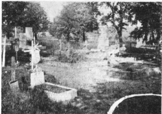
Groby żołnierskie na cmentarzu w Soczewce

G a b i n. Już w kilka dni po zajęciu miasteczka Niemcy 21 września 1939 roku dokonali przy szkole egzekucji 20 osób. Drugiej potwornej zbrodni dokonali okupanci w tym mieście 15 czerwca 1941 roku. Pod murem kościoła rozstrzelali 12 mieszkańców Gąbina i okolic. Po wojnie wystawiono pomnik ku czci ofiar egzekucji. Na pomniku zostało wypisanych 10 nazwisk zamordowanych. Nazwisk 2 zamordo-