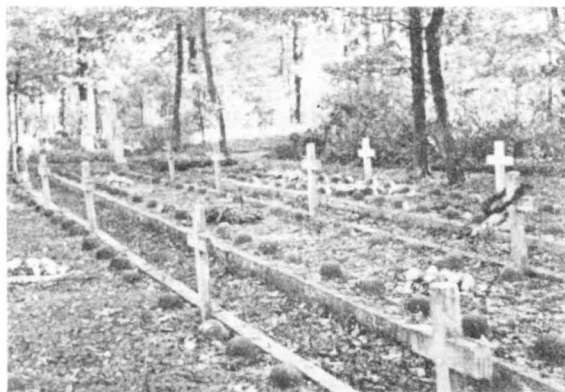
Mogiły żołnierzy września na cmentarzu w Dobrzykowie

Duża część powiatu była objęta działaniami bitwy nad Bzurą. Dlatego też cała Ziemia Gostynińska była usiana wyjątkowo dużą ilością mogił wrześniowych. Mogiły żołnierskie wyrosły na polach i łąkach, w lasach i przy drogach. Większość tych mogił kryła w sobie bezimiennych żołnierzy. W początkach okupacji hitlerowskiej dokonano ekshumacji wielu mogił i przeniesienia zwłok do grobów zbiorowych znajdujących się na cmentarzach parafialnych.