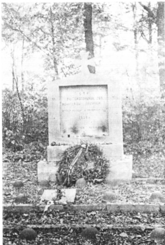
Skromny pomnik ku czci poległych na cmentarzu w Dobrzykowie