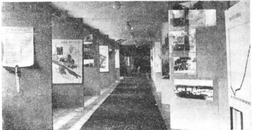
Fragment wystawy: „Płock w latach 1945—1970 w fotografii”. (Sekcja Ikonograficzna TNP) i „Rozwój przestrzenny Płocka” (Sekcja Architektury i Urbanistyki TNP)