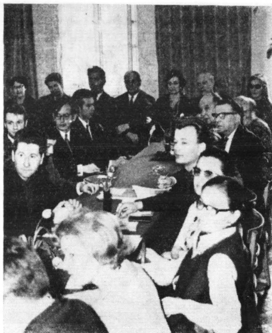
Fragment sali w czasie obrad sesji naukowej Komitetu Badań Rejonów Uprzemysławianych w dniu 26 kwietnia 1970 r. w TNP

Dość bogata i żywa dyskusja wzbogaciła problematykę, którą należy przebadać, przemyśleć