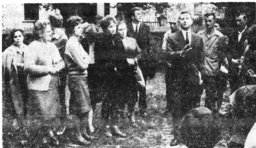
Wycieczka działaczy i sympatyków PTTK z Płocka i Gostynina w Luszynie