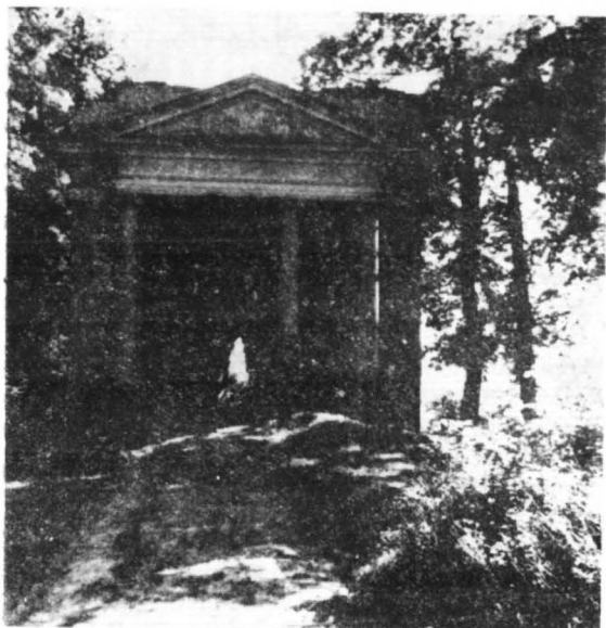
Świątynia milczenia w parku słubickim

Słubice doczekały się w XIX wieku swojej panoramy, namalowanej przez G. Berenda. Na obrazie widać wiele topól włoskich, których obecnie nie można zobaczyć w parku, ponieważ zostały wycięte przez Niemców w czasie ostatniej wojny.