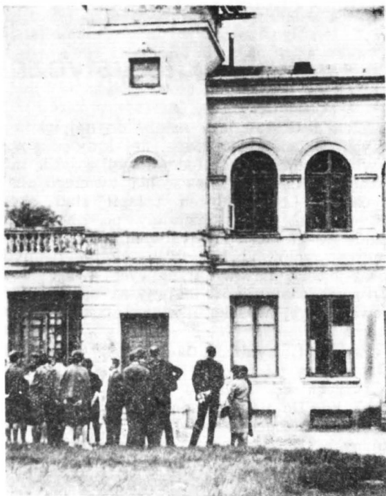
Wieża pałacu w Sannikach z tablicą upamiętniającą pobyt Fr. Chopina w 1828 r.