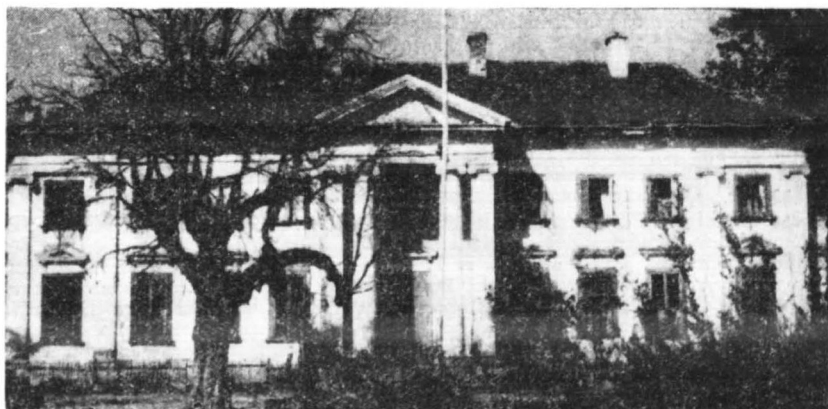
Klasycystyczny pałac z XVIII w. w Studzieniu

I wreszcie Łąck. Miejscowość posiada pseudorenesansowy pałac z drugiej połowy XIX wieku. Przed wojną była to siedziba letniskowa marszałka Rydza-Smigłego. Obecnie w pałacu mieści się Dom Wczasowy FWP. Mi-