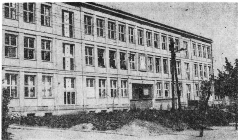
Nowy budynek Szkoły nr 3 w Sierpcu

150, a 168 nauczycieli było bezpośrednio zaangażowanych na tych kursach.