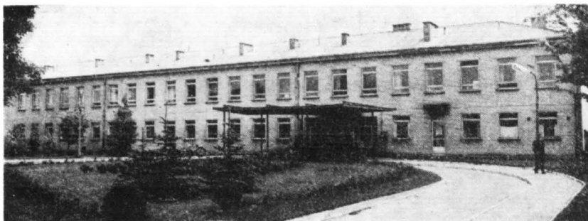
Nowy budynek Szpitala Powiatowego w Sierpcu

jest radnym Powiatowej Rady Narodowej Jest odznaczony Złotym Krzyżem Zasługi i Złotą Odznaką za Zasługi dla Województwa Warszawskiego.