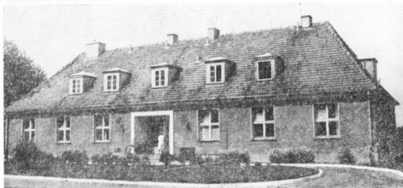
Pawilon, gdzie mieści się obecnie oddział chorób płucnych, dawniej był to oddział zakaźny

Ilość udzielonych porad w lecznictwie otwartym w wybranych latach obrazuje poniższe zestawienie: