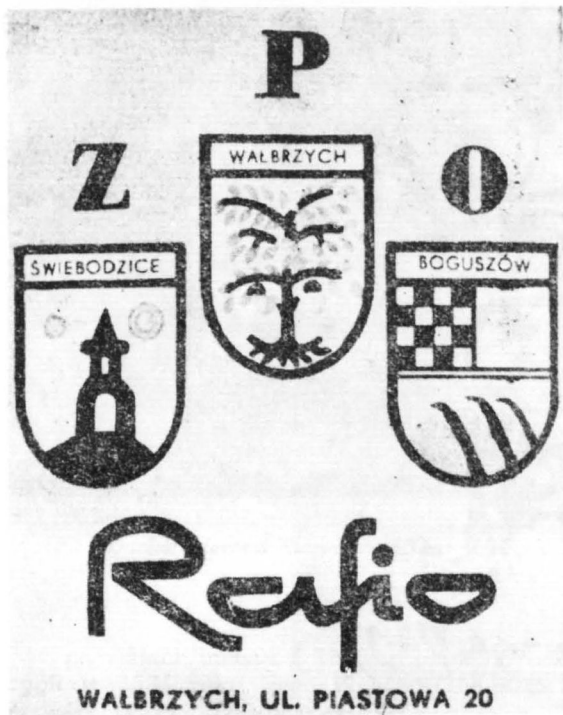
Przykład zastosowania herbów w znakach towarowych

— nadany po 1945 roku (np.: herb Studzianek Pancernych)