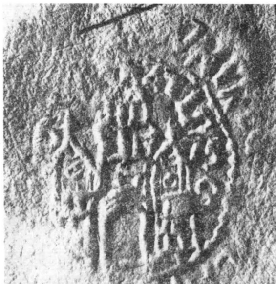
Odcisk pieczęci Sierpca z 1573 roku

W ścianę wieży kościoła farnego od strony południowo-zachodniej wmurowany jest kamień, na którym widnieją wykuty jeszcze jeden herb, a ściślej mówiąc elementy godła herbu Slepowron o dość pierwotnej formie. Herb ten był szeroko rozpowszechniony wśród mazowieckiej szlachty. Pieczętowało się nim około stu rodzin a wśród nich Krasieńscy, Glińscy Szymanowscy. Najstarsza znana pieczęć pochodzi z połowy XV-go wieku. Herb zawiera na półnogotyckiej tarczy godło złożone z kruka, podkowy i krzyża. Pełny herb uzupełniają helm