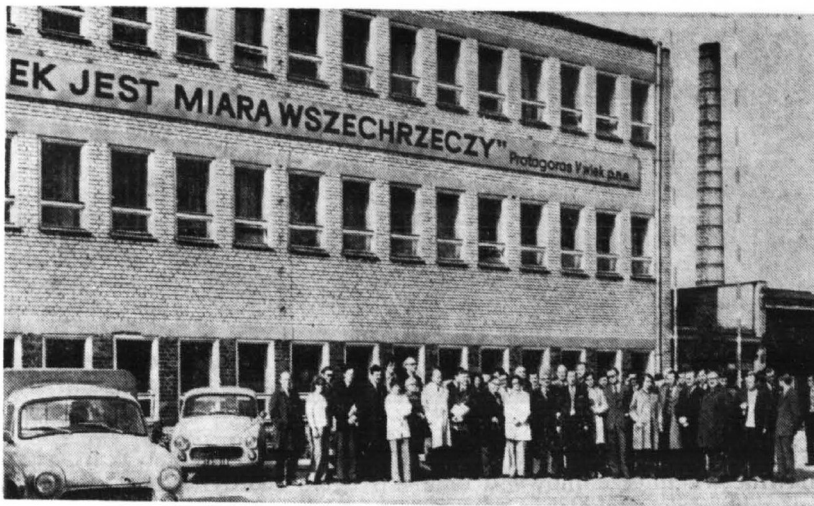
27.IX.1974 r. Uczestnicy konferencji przed biurowcem Zakładów Stolarki Budowlanej „Stolbud” w Płocku.