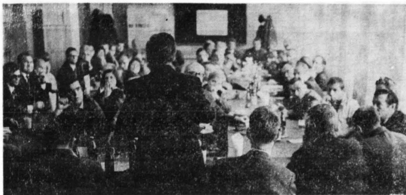
W świetlicy Zakładów Stolar-ki Budowlanej. Po zwiedzeniu fabryki 2-godzinne robocze spotkanie pracowników nauki z praktykami z tych Zakładów.

stwa niektórych poczynań zakładów pracy w zakresie budownictwa mieszkaniowego oraz korzyści, jakie w zakresie zaspokojenia potrzeb mieszkaniowych ludności można by uzyskać przez zmianę istniejącego stanu rzeczy.