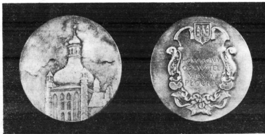
Medal Honorowego Obywatela Miasta Płocka (śr. 94 mm) projektował i wykonał artysta-plastyk — Adolf Ryszka z Warszawy.

Gdy spojrzymy wstecz na ubiegły 1977 rok, odnajdziemy w nim szereg znaczących faktów, potwierdzających skuteczność drogi społeczno-ekonomicznego rozwoju, przyjętej przez VI