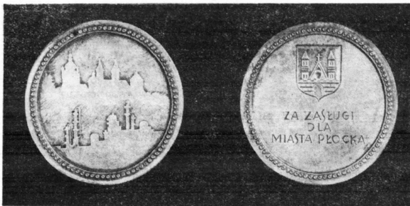
Medal Za zasługi dla miasta Płocka (śr. 87 mm) projektował i wykonał artysta-plastyk — Adolf Ryszka z Warszawy.

i VII Zjazd Partii. Delegaci naszego miasta udali się na II Krajową Konferencję Polskiej Zjednoczonej Partii Robotniczej z konkretnym dorobkiem osiągniętym ofiarnym wysiłkiem załóg płockich zakładów pracy, wysiłkiem działaczy społecznych, pracowitością całego społeczeństwa.