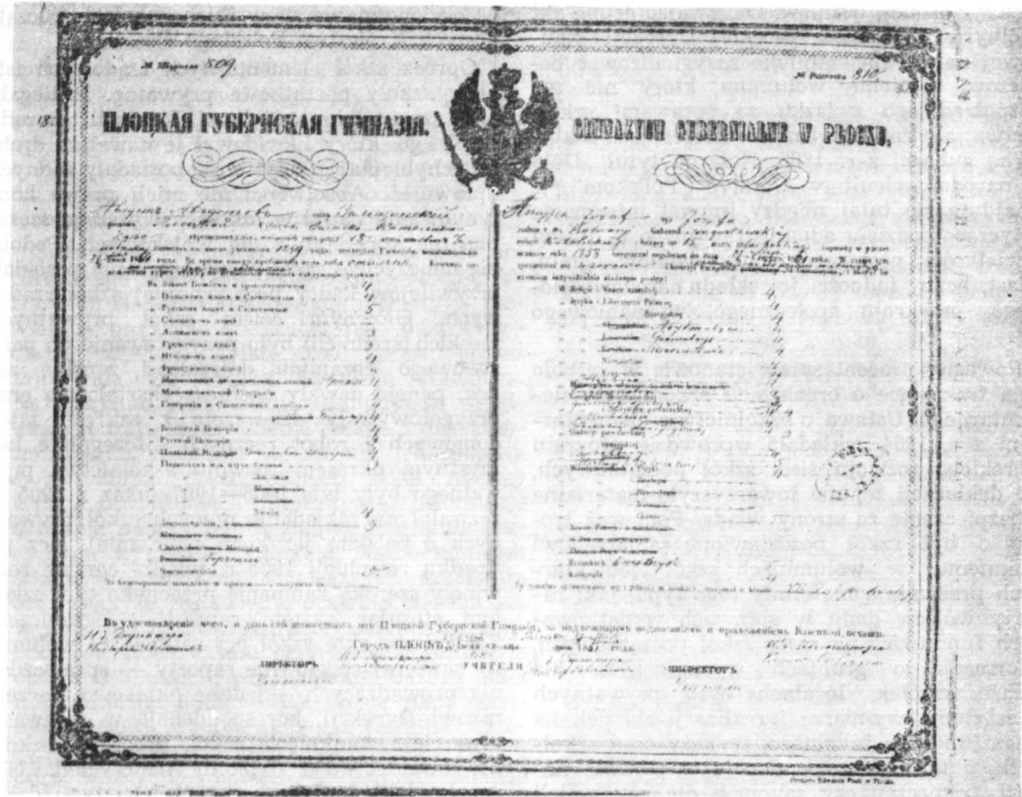
Fragmenty dwóch świadectw Gimnazjum Męskiego w Płocku z roku 1861.

nie sposób pominąć licznej grupy personalistów nauczycieli. Zawierają one korespondencję związaną z mianowaniem i zwalnianiem z posad, przeniesienia służbowe, wykazy stanu służby, raporty i opinie, protokoły z odbytych egzaminów kwalifikacyjnych, korespondencji dotyczących spraw emerytalnych itp. Materiał ten ilustruje stan i poziom kadry pedagogicznej realizującej program nauczania i wychowania młodzieży polskiej w drugiej połowie XIX wieku i początkach naszego stulecia.