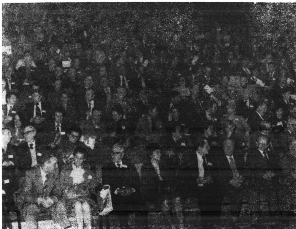
Teatr Płocki. Obrady plenarne z udziałem 530 uczestników III Kongresu Krajoznawczego.

13. W coraz większym stopniu współczesne krajoznawstwo musi uwzględniać w zakresie