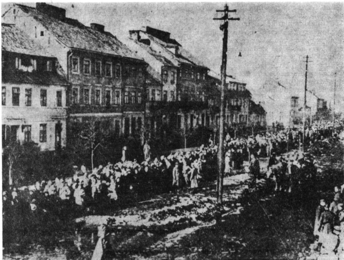
Nieznana dotychczas fotografia wykonana w marcu 1941 r. (autor niewiadomy) przedstawiająca ul. Szeroką — obecnie ul. Józefa Kwiatka — z tysiącami Żydów płockich wysiedlanych, barbarzyńsko przez hitlerowców do obozów zagłady. Fotografia znajduje się w albumie „We Shall Never Forget” (Haifa 1965), wydany przez dyrektora Towiach Friedmana, a przekazany w darze na rzecz zbiorów TNP w dniu 1 sierpnia 1980 r. przez sierpczanina Leona Gongolę — piekarza zamieszkałego w Nowym Jorku.

Warto, by ponownie przedyskutować „sine ira et studio” styl pracy TNP, może opracować nowy schemat organizacyjny, regulaminy pracy, a może zweryfikować członków. Chodzi przecież o instytucję o olbrzymim znaczeniu dla Płocka i Mazowsza Płockiego, instytucję naukową o 160-letniej tradycji i tak pięknym dorobku.