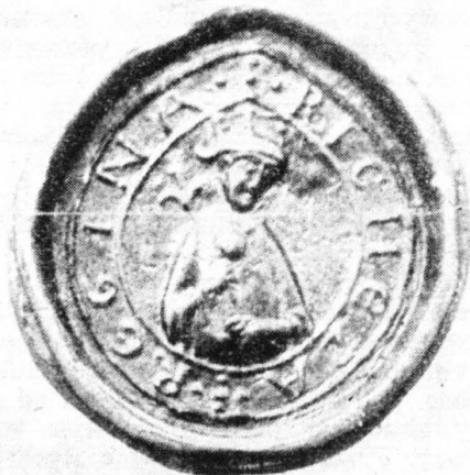
Siegel der Königin Richeza