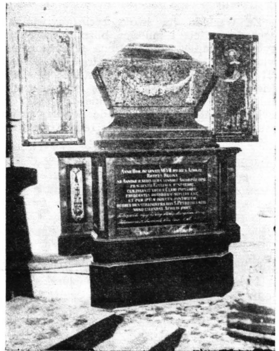
Sarkofag królowej Ryczezy w kaplicy św. Jana w katedrze kolońskiej. Napis w języku łacińskim i polskim. Portrety z ok. 1400 roku przedstawiają Ryczezę (z prawej strony) i jej brata Hermana II — arcybiskupa Kolonii w latach 1036—1056.

W 1063 r. Rycheza zmarła w Saalfeld. Wbrew jej pierwotnie wyrażanej woli nie przewieziono jej zwłok do Brauweiler, lecz arcybiskup Anno II pochował je w kolońskim kościele kolegiackim Panny Marii ad gradus, który zbudował przy finansowym wsparciu Ryczezy. Przez zabranie zwłok Ryczezy, dla których był przygotowany grób w krypcie kościoła przy opactwie Brauweiler, opactwo to straciło obszerne winnice w Klotten nad Mozela. Rycheza jeszcze za życia przekazała kla-