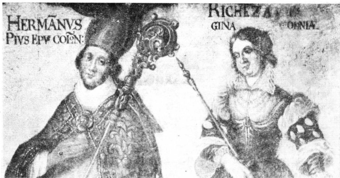
Rycheza — Regina Poloniae i jej brat Herman II — arcybiskup Kolonii. Fragment barokowego obrazu fudatorów z 1657 r. w byłym kościele przy opactwie Benedyktynów w Brauweiler.