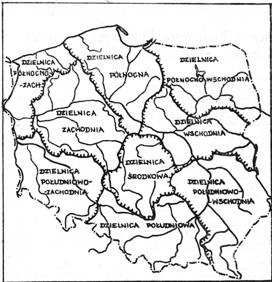
RYS. 1. REGIONALIZACJA POLSKI W NAWIĄZANIU DO HISTORYCZNYCH PODZIAŁÓW DZIELNICOWYCH.

sunku do tradycji zapomnianego piastowskiego dziedzictwa.