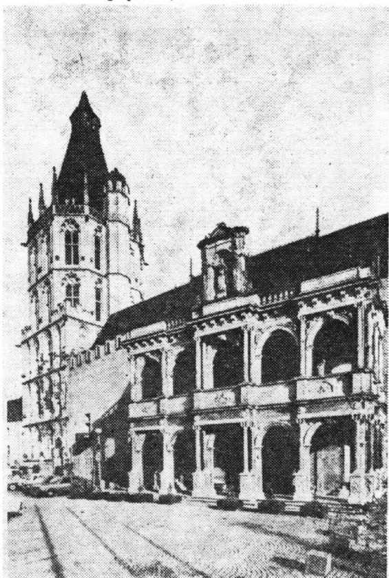
Zabytkowy ratusz w kolonii.