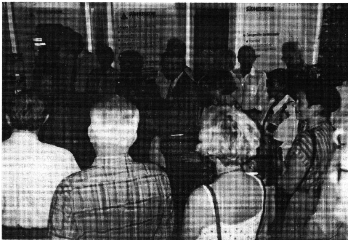
Zarząd TNP wraz z grupą plockzan na otwarciu wystawy "Płock w fotografii" w Klubie w Darmstadt w dniu 3 lipca 1992 r.