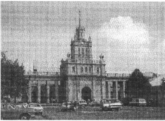
Centralny Dworzec Kolejowy w Brześciu /obecnie polska firma renowacji zabytków PKZ w Warszawie przystąpiła do remontu obiektu/.