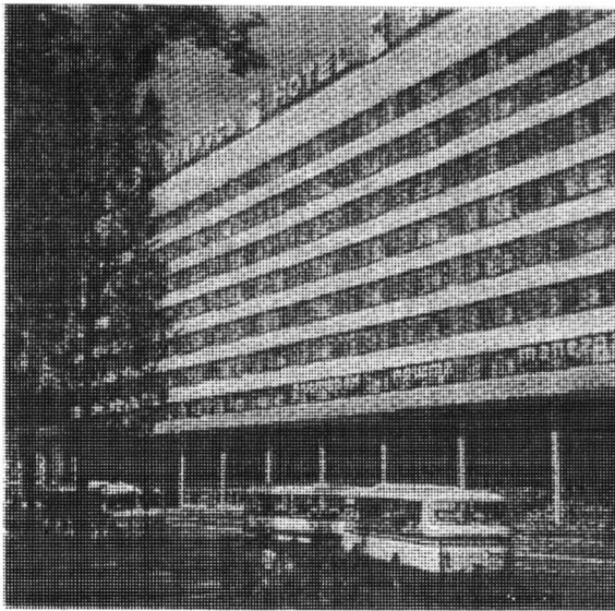
Hotel "Białoruś" w Brześciu, w którym zamieszkiwali uczestnicy II Międzynarodowego Sympozjum Biznesu.