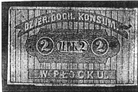
Bon z okresu Królestwa Kongresowego