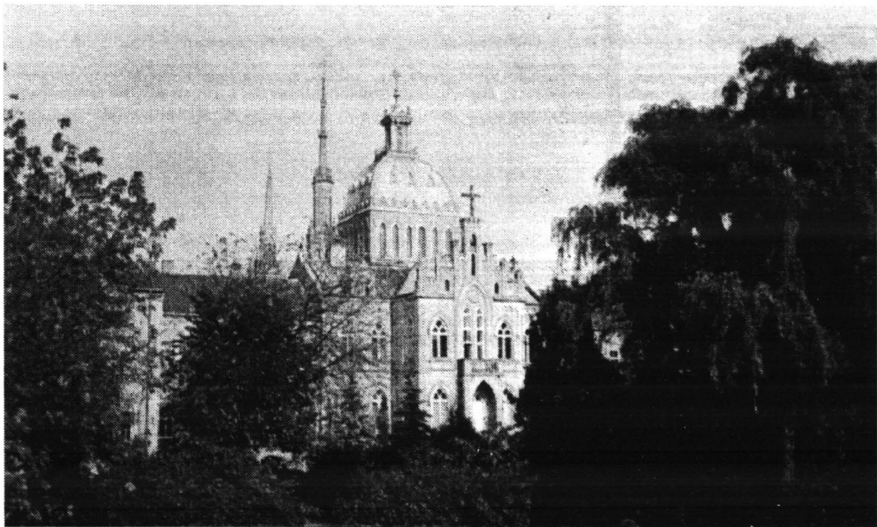
Świątynia i Klasztor od strony ogrodu

P. S. We wszystkich parafiach Kościoła Starokatolickiego Mariawitów jest do nabycia "Informator", który zawiera więcej wiadomości o mariawityzmie.