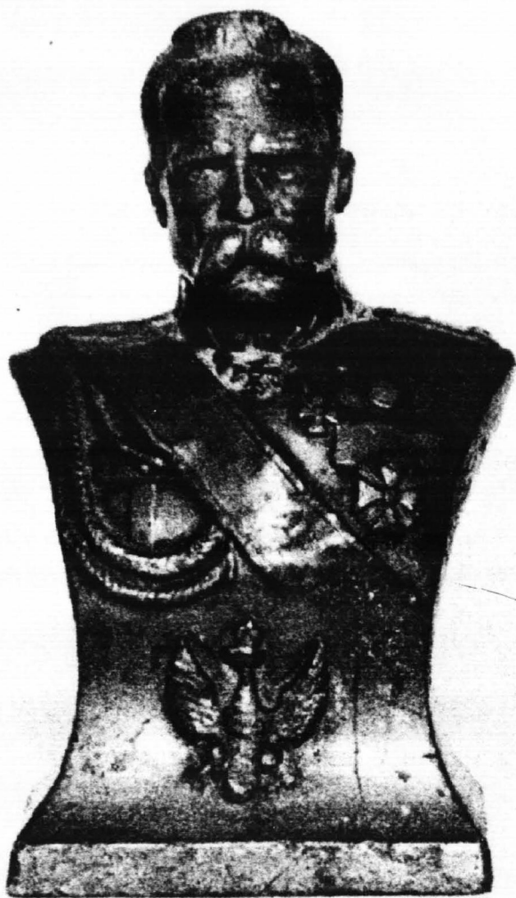
Popiersie Józefa Piłsudskiego ze stopu metali. Autor anonimowy. Okres międzywojenny

Mimo poświęceniu ekspozycji dość dużej powierzchni wystawienniczej przez Muzeum Mazowieckie, pokazano jedynie część (ok. 650 eksponatów) wszechstronnej i największej w kraju i na obczyźnie prywatnej kolekcji piłsudczanów, będącej własnością warszawskiego kolekcjonera. Wybitny zbieracz jest synem peowiaka i uczestnika wojny 1920 r. Z rodzinnego domu wyniósł emocjonalny stosunek do historii, a szczególnie do Marszałka Józefa Piłsudskiego. Jako rasowy kolekcjoner przez wiele lat zajmował się bezustannie i z godnym podziwu uporem zdobywaniem, zabezpieczaniem i katalogowaniem przedmiotów związanych w różny sposób z postacią Józefa Piłsudskiego. Pełna jego kolekcja (ponad 1500 ważniejszych eksponatów, nie licząc księgozbiorów i prasy) nie była nigdy pokazywana publicznie w całości, gdyż przekracza to praktycznie możliwości wystawiennicze. Do każdej z wystaw dokonywano wyboru nieco innych przedmiotów, ale głównie mogących zainteresować szerszego odbiorcę. Największa prezentacja zbiorów odbyła się dotychczas w Suwałkach, mieście rodzinnym kolekcjonera, gdzie spę-