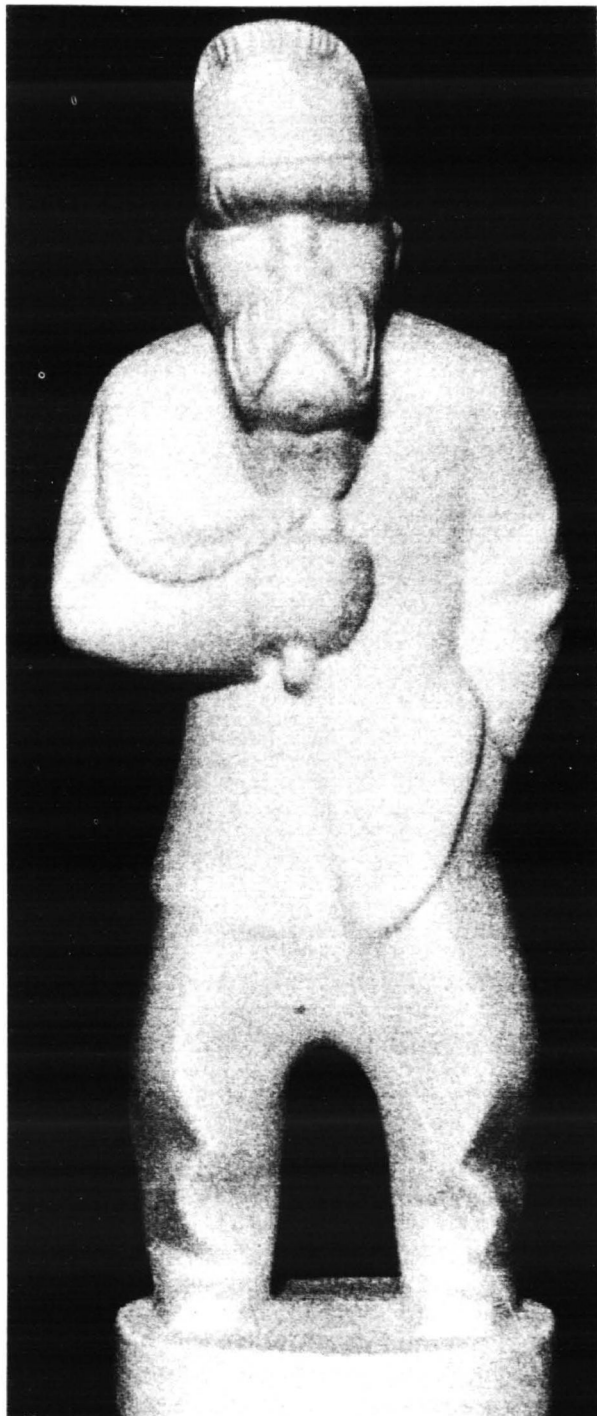
Figurka porcelanowa (FP Ćmielów) autorstwa A. Siemaszki. Okres międzywojenny

miątkowym wykonane przez anonimowych już dziś twórców. Warto zwrócić szczególną uwagę np. na unikatową w skali światowej kolekcję medalionów, medali i plaket ze znakomitymi portretami Piłsudskiego, mogącymi ozdobić każdą najpoważniejszą nawet ekspozycję poświęconą Marszałkowi. Należy zaznaczyć, że bardziej szczegółowe i specjalistyczne omówienie zbiorów Janusza Ciborowskiego przekracza ramy niniejszej publikacji, gdyż należałoby wyróżnić i wskazać wiele przedmiotów i dokumentów zasługujących na szczególną uwagę.