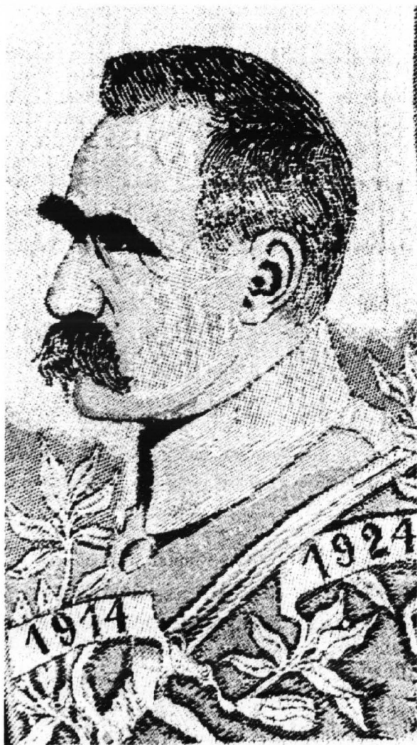
Portret Józefa Piłsudskiego (tkanina jedwabna). Autor anonimowy. Okres międzywojenny

Na zakończenie należy stwierdzić, że obecna plocka wystawa jest dobrym przykładem kontaktów placówek muzealnych z prywatnymi kolekcjonerami. Dokonania wybitnych zbieraczy, zwłaszcza związanych tematycznie z Legionami 1914-1918 r., wojną polsko - bolszewicką 1920 r., czy też, jak w omawianym przypadku, z całym okresem działalności Józefa Piłsudskiego, trudno przecenić. Ograniczanie tej tematyki w okresie powojennym, również w dziedzinie muzealnictwa, spowodowało różnego rodzaju luki w zbiorach i archiwach państwowych. Międzywojenne zbiory uległy znacznemu rozproszeniu i częściowemu zniszczeniu. Warto tu ponadto nadmienić, że najcenniejsze eksponaty kolekcji przedwojennego Muzeum Piłsudskiego w Belwedercze wywiezione zostały w 1939 r. za granicę (część pozostałych znajduje się w Archiwum Akt Nowych w Warszawie). Chociaż poważna część najwybitniejszych