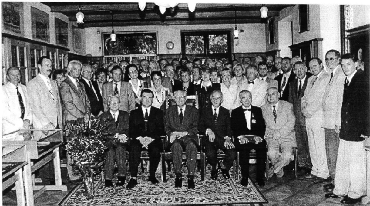
Uroczystość 60-lecia nawiązania kontaktów prof. Aleksandra Gieysztor z Płockiem i 80-lecia Jego urodzin (6 lipca 1996 r.)

lubił Płock. Już same tytuły artykułów zamieszczonych w "Notatkach Płockich" są wymowne: "Mazowsze w kulturze Polski średniowiecznej", "O Polsce a przede wszystkim o księciu Bolesławie", "Przed portalem płockiej katedry", "Urząd wojewódzkiński w Polsce i na Mazowszu".