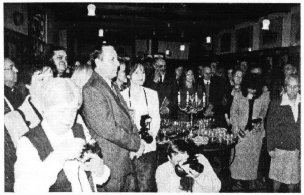
Na otwarcie ekspozycji przybyło ponad 200 osób

Liczni kapłani, harcerze i mieszkańcy Płocka, którzy oddali życie za Wiarę i Ojczyznę na przestrzeni wieków, w tym podczas licznych powstań i wojen: bł. abp. Antoni Julian Nowowiejski, biskup płocki i bł. biskup sufragan Leon Wetmański. Przebywali tu Ignacy Mościcki, naukowiec, Prezydent Drugiej Rzeczypospolitej, Honorowy Obywatel Miasta Płocka, gen. bryg. Władysław Anders, dowódca Nowogródzkiej Brygady Kawalerii. (...) W latach 1930-1932 przebywała w płockim klasztorze Zgro-