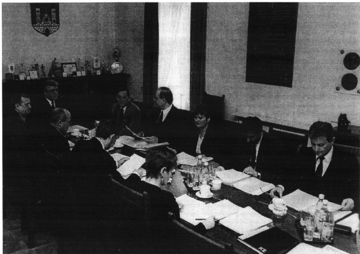
Obrady Zarządu Miasta Płocka

pozostał nadal na terenie Mazowsza Północnego największym ośrodkiem społeczno-gospodarczym. Pomijam tutaj Warszawę, gdyż ma ona inne funkcje. Czynniki miastotwórcze decydujące o dalszym rozwoju Płocka to: