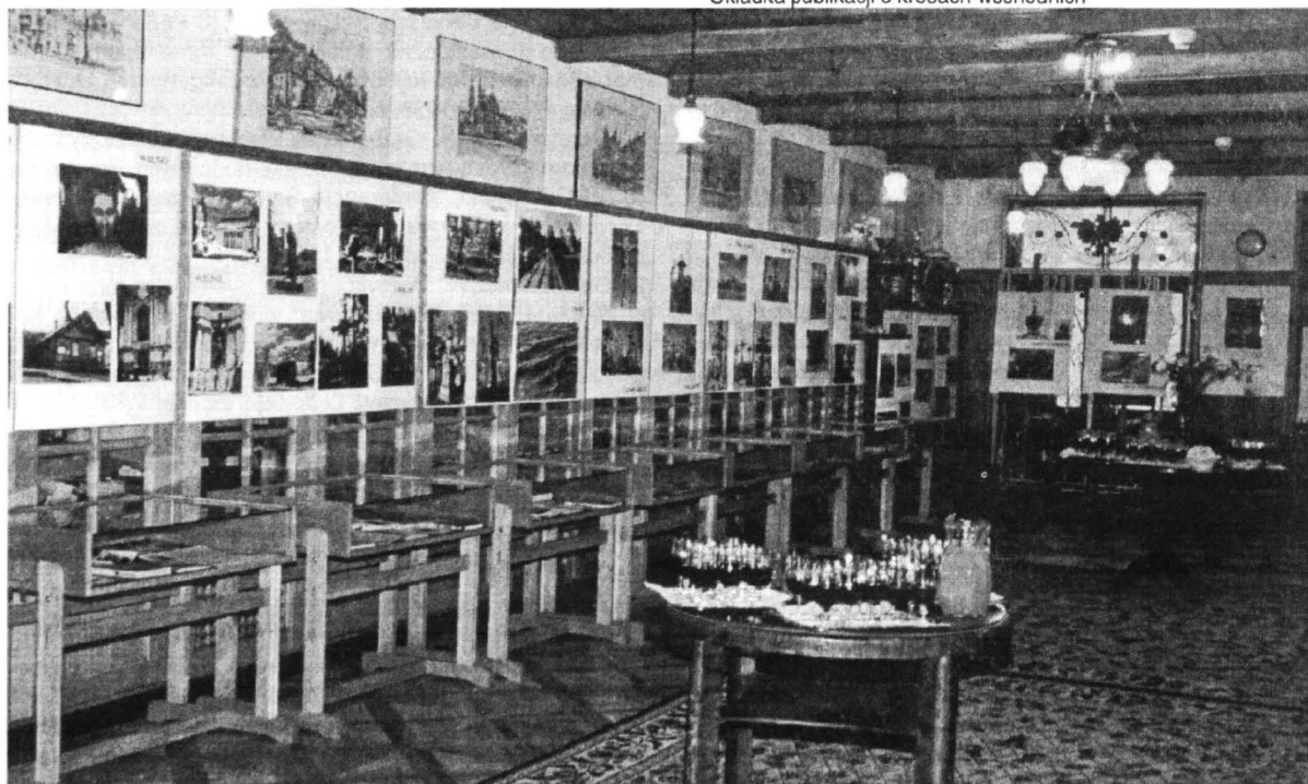
Sala wystawowa Działu Zbirów Specjalnych - ekspozycja fotogramów