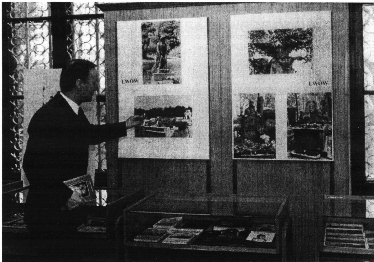
Autor wystawy omawia poszczególne fotografie