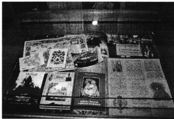
W 20 gablotach zgromadzono liczne druki i publikacje