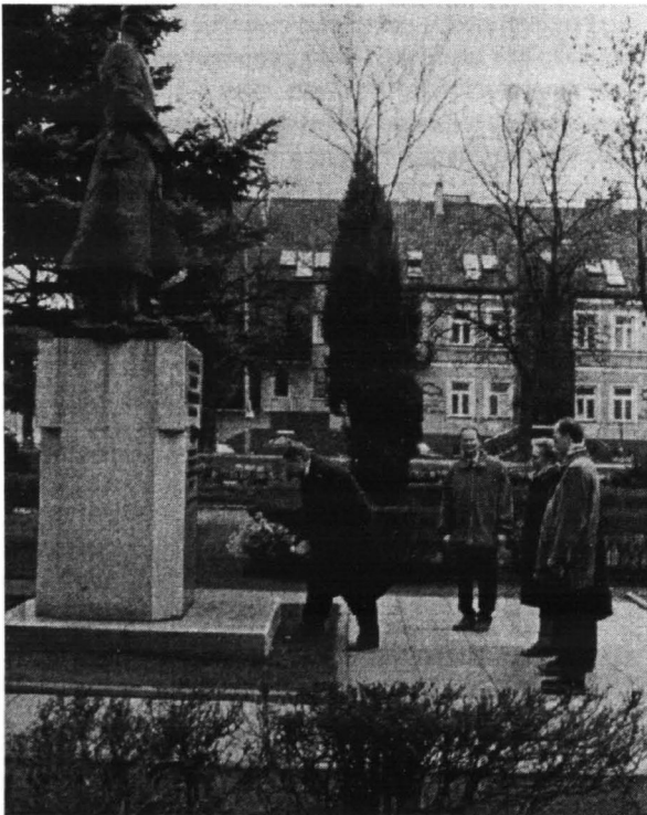
Delegacja TNP złożyła kwiaty pod pomnikiem Marszałka Józefa Piłsudskiego, Honorowego Obywatela m. Płocka.