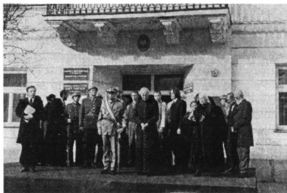
Aktorzy Płockiego Teatru Dramatycznego przygotowali inscenizację z pobytu J. Piłsudskiego w Płocku