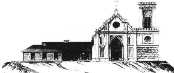
Kościół ewangelicki i zabudowania gospodarcze na Wzgórzu Zamkowym w Gostyninie

Na wystawie pokazano także archiwalia dotyczące zbrodni niemieckich na ziemi gostynińskiej w 1945 r. Wśród nich są dokumenty odnoszące się do getta żydowskiego w Gostyninie - protokoły zeznań świadków, osób ocalałych z getta. Na tej podstawie ustalono, że getto w Gostyninie obejmowało teren po prawej stronie ul. Zamkowej od Rynku do ul. Bagnistej oraz jeden dom przy ul. Bagnistej, jeden dom przy ul. Piłsudskiego (?), lewa strona od ul. Olszowej (obecnie Kardynała Wyszyńskiego) i od ul. Piłsudskiego do rzeki. Łącznie był to obszar 1,5 ha. Getto założone zostało 15 marca 1941 r., a zlikwidowane 17 kwietnia 1942 r. Zgromadzono tam ok. 3 tys. osób, wyłącznie Żydów z Gostynina i bliskiej okolicy oraz jedną obywatelkę palestyńską. Więźniowie wykonywali różne prace polowe, warsztatowe, budowlane zależnie od zarządzania władz niemieckich. Rację żywnościową stanowiło: 250 g chleba dziennie, 100 g tłuszczu tygodniowo, 25 dkg cukru miesięcznie, ćwierć litra mleka odciganego dziennie. Pracujący poza gettem otrzymywali ćwierć kg chleba dodatkowo. W obozie nie było epidemii. Lekarze nie mieli wstępu do getta. Egzekucje odbywały się poza obozem. Zmarłych chowano w Wólce Łąckiej. Kierownikiem i funkcjonariuszami obozu byli: Jakob Pohl, Buder, Gustaw Baum Arendt, Gustaw Llichman, Weiland - szef Urzędu Pracy i Hein - szewc 3 .