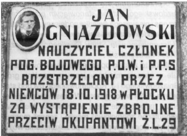
Tablica na symbolicznym grobie J. Gniazdowskiego na cmentarzu w Sierpcu

Sama uroczystość odsłonięcia i poświęcenia tablicy odbyła się 24 czerwca 2001 r. Data nie została wybrana przypadkowo, bowiem tego dnia przypadała 112 rocznica urodzin i jednocześnie dzień Jego