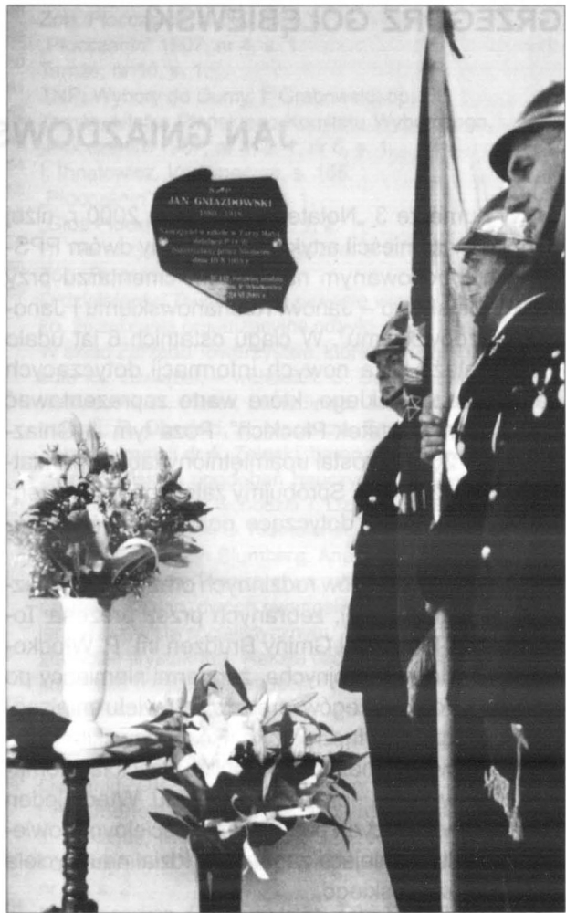
Uroczystość odsłonięcia tablicy w Turzy Małej - 24 czerwca 2001 r.