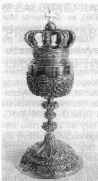
Puszka na komunikaty ofiarowana przez cara Mikołaja I, 1843 r.

ców parafii farniej. Kończyły się lata świetności plockiej fary. Szczególnie tragicznymi dla miasta i fary okazały się pierwsze lata potopu szwedzkiego (1655-1656). Duże straty ponieśli mieszkańcy Płocka, a także kościół plocki. Również w okresie wojny północnej w początkach XVIII w. Szwedzi dokonali w mieście wielkich zniszczeń. Autor książki przytacza plastyczny opis sytuacji miasta przedstawiony w Korespondencji Płockim z 1881 roku (nr.57): „Świątynie zrabowane, krwią zbroczone, stały otworem, domy zostały spalone...”.