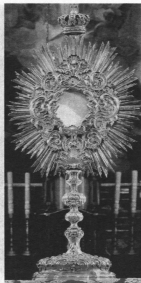
Monstrancja darowana przez cara Mikołaja I, 1843 r.

Już w latach trzydziestych XVIII wieku kościołowi farnemu groziło zawalenie. Wisła naruszyła stabilność wzgórza, na którym zbudowany był kościół. Dlatego w latach sześćdziesiątych kościół farny uległ zasadniczej przebudowie. Kościół otrzymał zupełnie nowy kształt zewnętrzny jak i wewnętrzny. Główne wejście do kościoła znajdowało się teraz od strony Staro-rynku, natomiast ołtarz główny i prezbiterium znalazło się od strony Wisły tak jak to jest dzisiaj. Budowla została znacznie zmniejszona. Z 22 ołtarzy jakie posiadał kościół przed przebudową pozostało tylko 7, zlikwidowano też wszystkie kaplice. Nad przebudową czuwał jej proboszcz Sebastian Wawrzyniec Starorypiński (1745-1773).