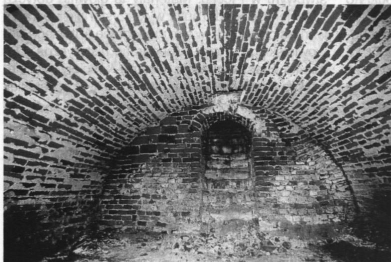
Jedna z krypt grobowych z XVI wieku pod farą plocką

Ks. Michał Grzybowski omawia na łamach swojej książki fakt mało znany z dziejów plockiego kościoła, a mianowicie przeniesienie kolegiaty św. Michała do kościoła św. Bartłomieja. Stało się to ostatecznie 14 maja 1731 r. Na mocy reskryptu biskupa Załuskiego kapituła kolegiacka ze swoimi funduszami przeniosła się do kościoła św. Bartłomieja. Do-tychczasowy proboszcz farny został prałatem kolegiaty. Uzyskana suma 15 tys. złotych polskich, uzyskana za sprzedaż kościoła św. Michała jezuitom, miała być przeznaczona na pilną przebudowę kościoła farnego. Kościół farny nosił nazwę kolegiaty do 1819, kiedy to biskup Adam Prażmowski na mocy rozporządzenia Stolicy Apostolskiej dokonał supresji (likwidacji) starożytnej kapituły plockiej.