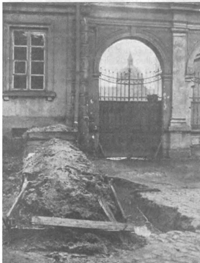
Barykada na ulicy Płocka 18

Wydział Opieki nad Uchodźcami na kilka dni przed najazdem bolszewików zaprzestał ich rejestracji. Setki mężczyzn, kobiet i dzieci znalazły