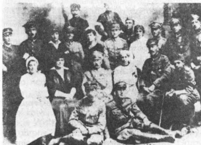
Komitet Obrony Płocka w 1920 roku 6