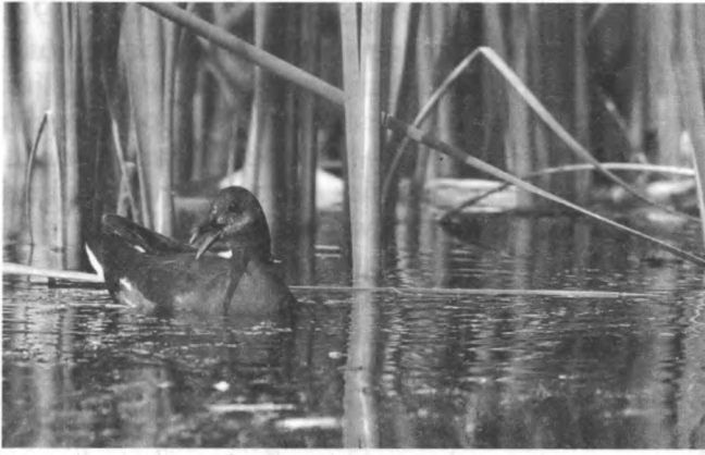
Kureczka wodna

Zielonka – Porzana parva . Skrajnie nieliczny gatunek lęgowy. Podobnie jak w przypadku gatunku poprzedniego, stwierdzono w okresie lęgowym 1989–1995 osiem terytorialnych osobników.