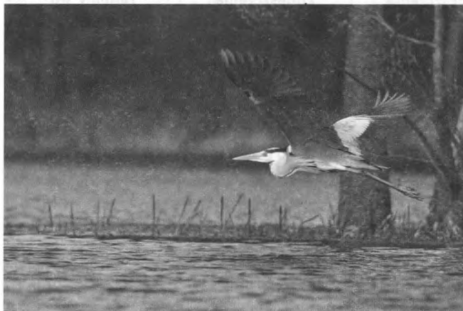
Czapla siwa

Na potrzeby lokalne pozyskuje się obecnie surowce mineralne takie jak piaski i żwiry dla celów budowlanych.