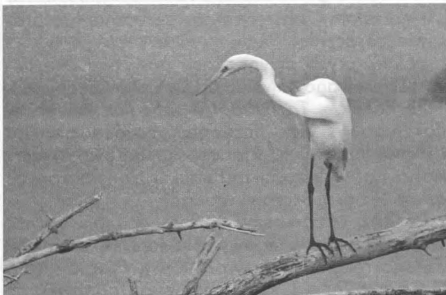
Czapla biała

Bocian czarny – Ciconia nigra . Istnieje możliwość gniazdowania, co najmniej 1 pary w kompleksie leśnym na północ od Jez. Szczawińskiego, gdzie w okresie lęgowym 1988 i 2004 roku obserwowano regularnie 1 parę. Pomimo licz-