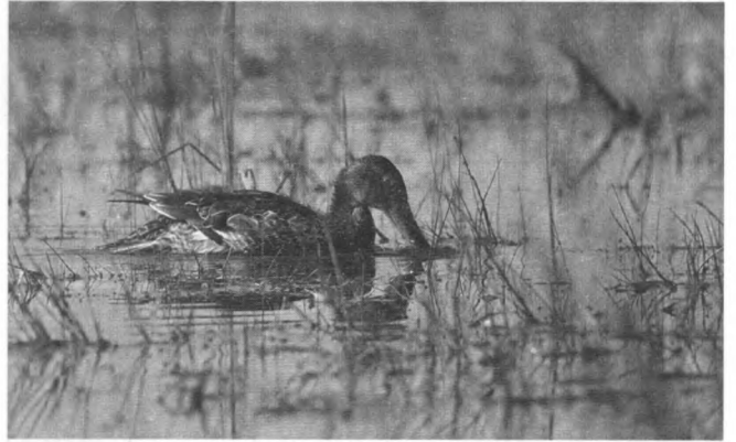
Perkonos samica

Sowa uszata – Aiso otus . Prawdopodobnie lęgowa. Głosy terytorialne słyszano w kwietniu i czerwcu na granicy lasów przyległych od wschodu do jeziora.