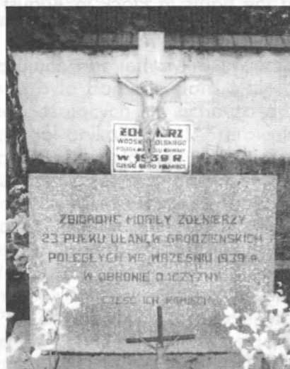
Zbiorowa mogiła 23 Pułku Ułanów Grodzieńskich poległych w 1939 roku w miejscowości Przysucha 10 koło Radomia

Wojna polsko-bolszewicka z sierpnia 1920 roku w Płocku jest wciąż żywym elementem pamięci nowych pokoleń mieszkańców. W walce obok ludności miasta uczestniczyło wiele jednostek wojskowych. 211 pułk ułanów, który pozytywnie zapisał się w historii walczył we wsi Góra 11 w pobliżu Płocka, gdzie odniósł zwycięstwo. Zdobył jeńców i broń. Dowódcy i oficerowie wykazali odwagę i bohaterstwo. Za czyny bojowe uzyskali order i odznaczenia. Pułk w swojej księdze chwały niesie następnym pokoleniom żołnierzy opis walki i postępowania w chwili zagrożenia Ojczyzny.