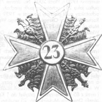
Odnaka pułkowa 23 Pułku Ułanów Grodzieńskich