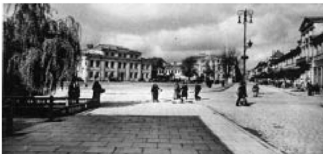
Fot. 8 Pocztkówka z Płocka z 1940 r., wydawca – F. Krauskopf z Królewca

ny radiowęzeł, który jak podaje dziennik uświadamiał i przeciwdziałał szerzeniu się plotek i pogłosek 155 . Za pośrednictwem radiowęzła przekazywano mowy Hitlera, transmitowano obchody rocznic i świąt partyjnych 156 . Na łamach prasy podawano program rozgłośni radiowych, szczegółowo omawiając programy muzyczne przypadające na dni wolne od pracy 157 .