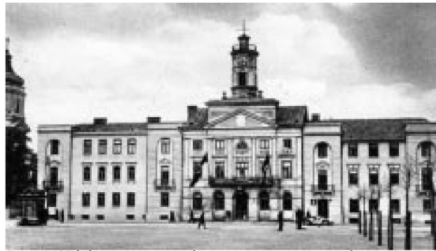
Fot. 7. Widok ratusza po wykonanym remoncie, wydawca Bruno Kamm

Wśród wydarzeń kulturalnych wspomnieć należy o odczytach i spotkaniach autorskich członków partii z przedstawicielami środowisk artystycznych i pisarskich, które odbywały się przy okazji zebrań partyjnych. W dniu 17 stycznia 1943 r. goszczono niemieckiego pisarza Felixa Riemkasta 158 , któremu największą popularność przyniosła powieści „Der Bonze” – ponad 50 000 sprzedanych egzemplarzy. Władze partyjne organizowały wykłady pracowników naukowych