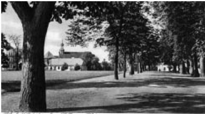
Fot. 4. Collegien-Platz – miejsce koncertów plenerowych (dziś Plac Obrońców Warszawy)