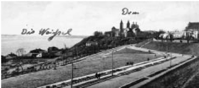
Fot. 6 Widok Wisły i ul. Mostowej stanowiącej wówczas deptak, wydawca Bruno Kamm