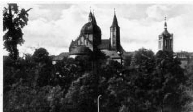
Fot. 5. Widok katedry od strony wschodniej na pocztówce wydanej przez firmę Bruno Kamm w 1940 r.

Obok wydawania widokówek z Płockiem Bruno Kamm zajmował się fotografowaniem mia-