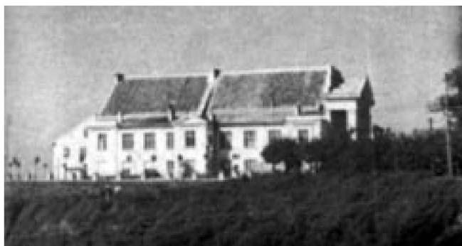
Fot. 1. Teatr płocki w 1939 r.

Z chwilą wybuchu wojny zamarło w Polsce życie kulturalne, a po rozpoczęciu okupacji i podziale państwa na okręgi przybrało ono różne formy w zależności od podległości administracyjnej. W Generalnym Gubernatorstwie pozostawiono szczątkową egzystencję kultury polskiej, poddając ją drobiazgowemu nadzorowi i ograniczeniom. W okręgu Prusy Wschodnie, w skład którego wchodził Płock, kultura narodowa już się nie odrodziła 1 . Zawieszono działalność wszystkich szkół, zabroniono wydawania polskich książek i czasopism, zakazano działalności polskich stowarzyszeń i organizacji 2 , zlikwidowano wszystkie istniejące w Płocku biblioteki, zamknięto muzea 3 , w tym Muzeum Przyrodniczo-Etnograficzne oraz Towarzystwo Naukowe Płockie, a ich gmachy przeznaczono na inne cele, np. w muzeum urządzono biuro rachunkowości rolnej (Landwirtschaftliche Buchstelle) 4 . Niemcy natychmiast zamknęli silnie związany z rozwojem i dbałością o kulturę polską płocki