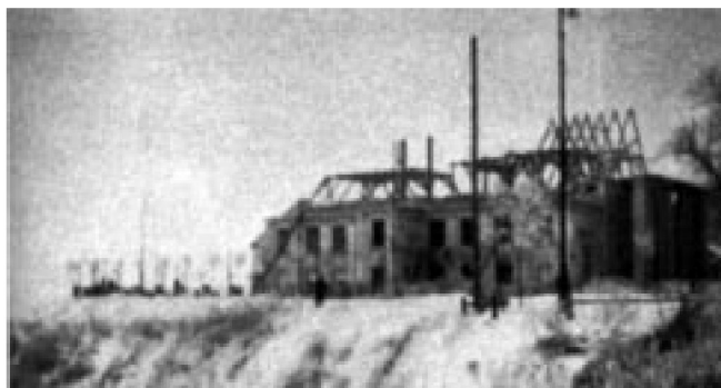
Fot. 2. Rozbiórka teatru płockiego zimą 1939/1940