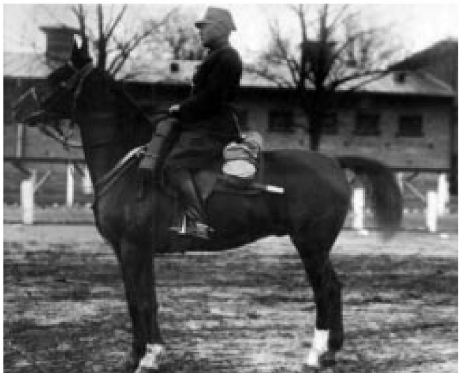
Fot. 6, 7. Rtm. Oksiuto-Dowiacki w koszarach płońskich w Płocku