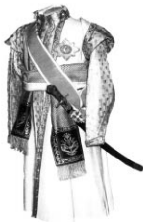
Rys. 4. Strój orderowy Kawalera Orderu Św. Stanisława