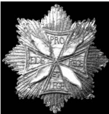
Rys. 8. Gwiazda Orderu Orła Białego z 1780 roku 16