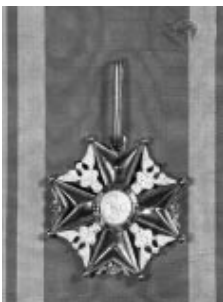
Rys. 2. Order Św. Stanisława z lat 1765–1795 (rewers)