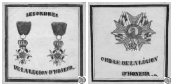
Rys. 10. Wizerunek orderu Legii Honorowej i gwiazdy orderowej. Druga i trzecia strona aktu nadania orderu Legii Honorowej dla Stanisława Matachowskiego w dniu 22 lipca 1807 roku w Dreźnie.

niósł dużą stawę. Po uzyskaniu zgody na pobyt w Białaczewie tam zamieszkał. Zainteresowany polityką europejską ze spokojem przyjął wiadomość o zwycięstwie Napoleona 14 października 1806 roku pod Jeną–Auerstaedt, ale dostrzegał też zabiegi Józefa Wybickiego i Jarosława Dąbrowskiego w sprawie Polski u cesarza Francji. W listopadzie Napoleon wyraził zgodę na tworzenie orga-