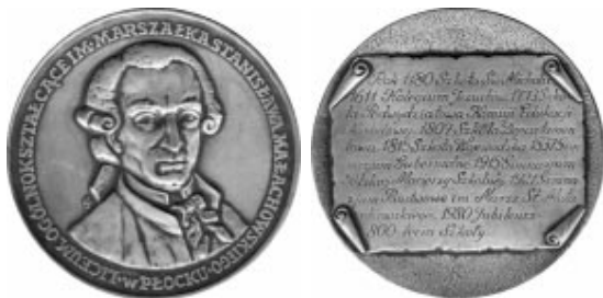
Rys. 11. Awers i rewers medalu pamiątkowego z roku 1980 z widocznym popiersiem Marszałka Stanisława Małachowskiego 25

sem. Urząd piastował krótko, 16 grudnia zrezygnował na korzyść Ludwika Gutakowskiego, otrzymując w zamian godność prezesa senatu i tytuł pierwszego wojewody Księstwa Warszawskiego. Wcześniej, 2. grudnia 1808 roku w sali senatorskiej Zamku Królewskiego przywitał króla Fryderyka Augusta. Pierwsze miesiące 1809 roku spędził w Białaczewie złożony chorobą. Wybuch wojny polsko-austriackiej i zwycięstwa wojsk polskich w bitwach na terenach ziem polskich zaboru austriackiego niosły nadzieję na polityczne zmiany. Nasze zwycięstwo i podpisany 14. października pokój w Wiedniu przyniósł powiększenie Księstwa Warszawskiego o ziemie zagarnięte przez Austrię w wyniku III rozbioru Polski. Powstały nowe departamenty, w tym radomski, w obszarze którego było miasto Końskie i Białaczewo. Ziemie i majątek Stanisława Małachowskiego przeszły do Księstwa Warszawskiego.