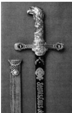
Rys. 5. Miecz ceremonialny Stanisława Augusta