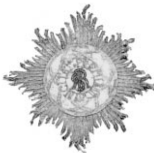
Rys. 3. Gwiazda Orderu Św. Stanisława z lat 1765–1795 12

skupa Męczennika (7 maja 1765 r.) ozdobił tym odznaczeniem Jacka (8 maja 1765 r.), Mikołaja (1766 r.), Antoniego (1767 r.) i Stanisława 5 (1770 r.). Inwestytura 6 , czyli uroczyste zaprzysiężenie Statutu Orderu w pierwszych latach jego funkcjonowania odbywało się zawsze 8 maja w Warszawie w kościele pod wezwaniem Świętego Krzyża, a później przeniesiono ją na Zamek Królewski. Uroczystość zaczynała się Mszą Świętą, po jej zakończeniu odczytywano listę wybranych do odzobienia Kawalerów, odczytywano Statut Orderowy 7 i po jego wystuchaniu każdy Kawaler podchodził do królewskiego tronu, wypowiadał przed Jąmużnikiem 8 słowa: „Przyrzekam kawalerskim słowem dotrzymania tych punktów dopiero przeczytanych”, klękał przed Królem na lewe kolano, który przewieszał przez ramię dekorowanego Krzyż na wstędze psowej z białymi brzegami. Wręczał gwiazdę w rękę, gołym mieczem ceremonialnym 9 dotykał ramienia i całował policzek ozdobionego. Kawaler