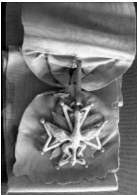
Rys. 7. Order Orła Białego z 1780 roku 15