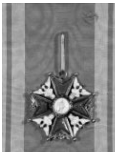
Rys. 1. Order Św. Stanisława z lat 1765–1795 11 (awers)