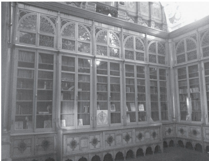
Fot. 7. Shakespeare Memorial Room w The Library of Birmingham