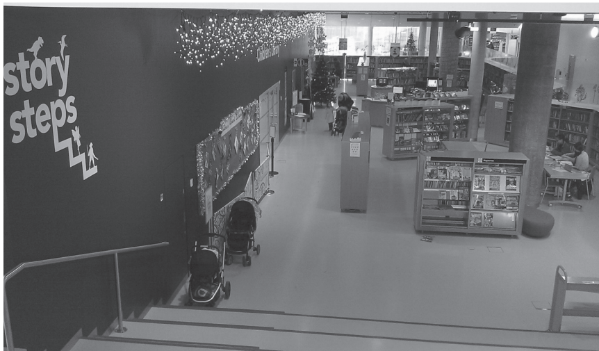
Fot. 3. Schody historii w The Library of Birmingham