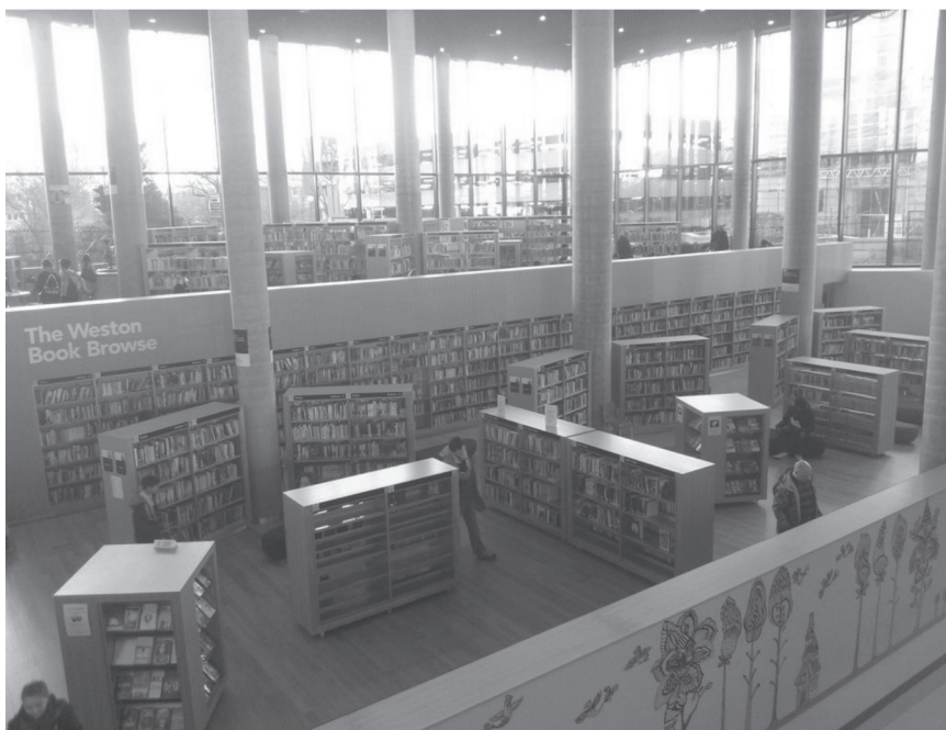
Fot. 2. Wypożyczalnia główna w The Library of Birmingham

Book Browse, czyli wypożyczalnia główna (fot. 2), znajduje się na podwyższeniu parteru, a można się tam dostać za pomocą ruchomych schodów. W całej bibliotece obowiązuje wolny dostęp do półek. Zbiory oznaczone żółtą metką mogą być wypożyczone, a z pozostałych można korzystać jedynie na miejscu.