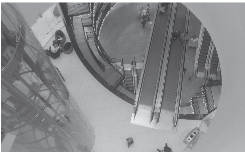
Fot. 5. Szklana winda w The Library of Birmingham

Z czwartego na siódme piętro można dostać się klatką schodową lub skorzystać ze specjalnej przeszklonej windy przypominającej kapsułę czasu (fot. 5). Piętra piąte, szóste i ósme są niedostępne dla czytelników. Wstęp do nich mają jedynie bibliotekarze i inni pracownicy biblioteki. Na trzech zamkniętych kondygnacjach znajdują się magazyny i pomieszczenia służbowe.