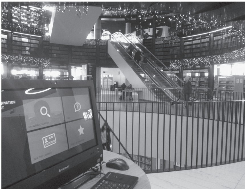
Fot. 4. Rotunda książek w The Library of Birmingham

W samym sercu The Library of Birmingham znajduje się rotunda z regałami wypełnionymi 400 tys. książek (fot. 4). Skalę wielkości i bogactwa wiedzy tego miejsca można określić, przytaczając słowa Jana Wiktora: „Biblioteka gromadzi bogactwa wieków i pokoleń, mogą z nich czerpać bez miary nieprzeliczone tłumy, a nigdy nam nie poskąpi ani mądrości, ani światła”.