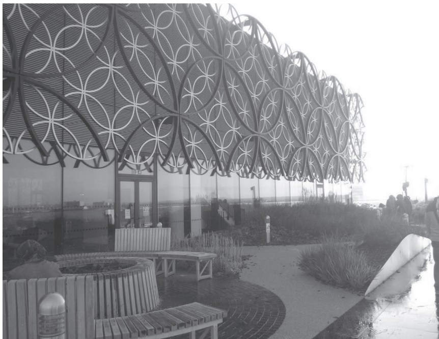
Fot. 6. Tajemniczy ogród w The Library of Birmingham