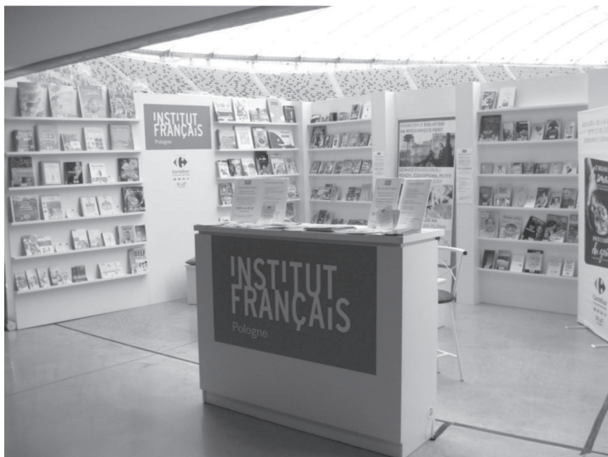
Fot. 4. Stoisko Instytutu Francuskiego w Polsce