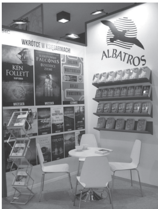
Fot. 2. Ekspozycja wydawnictwa Albatros